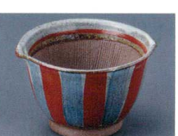
051-32-6B3 1,680円 2162062004 色トクサ麦とろ鉢(小) (11φ×6.8H)

割身向付小鉢珍珠 漆器和器土器 酒器 茶器 井茶碗 急須 茶器 和陶 オープン 耐熱 萬古焼 洋食器 碗皿 中華食器 ガラス 金属 茶道具 雜器 木竹製品 神・仏具