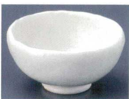
051-11-2F3 1,900円 1925064014 粉引丸小鉢 (9.6φ×5.5H)