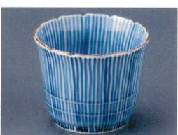
051-16-1B3 1,850円 1912044001 内外干筋小鉢 (9.8φ×7.1H)