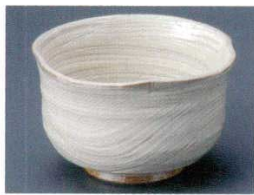
051-07-6A3 1,980円 2361051007 粉引刷毛目3.8輪花形井 (11×10×6.5H)