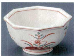
051-12-1B3 1,880円 2112044023 赤絵小花八角鉢 (12×12×6.2H)