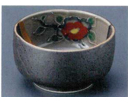
051-18-2A3 1,300円 1921047003 華南蜜3.6布目小鉢 (10φ×5.5H)