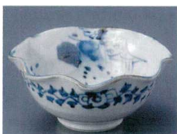
051-13-1B3 1,880円 1912043028 古染山水花型小鉢 (11.8φ×5.5H)