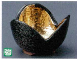
051-02-6A3 2,040円 2161060018 黒ちらし内金塗3.6三つ切形井 (10φ×6.5H) 051-03-6A3 1,540円 2161060019 黒ちらし内金塗3.0三つ切形井 (8φ×5H)