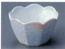
051-09-7F3 1,900円 2075074005 銀彩春秋二色吹八角小付 (8.7φ×5.5H)