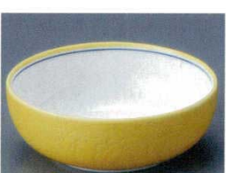
051-25-1B3 1,700円 1912046001 黄交趾唐草彫丸鉢 (10.8φ×4H)