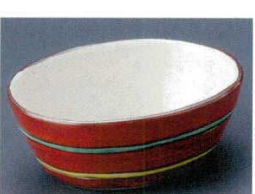
051-30-1K3 1,700円 1917045011 朱巻駒筋小判小鉢 (12×9.2×4.2H)