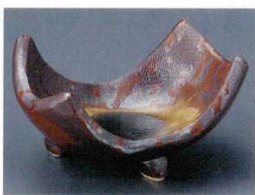
051-10-4B3 1,900円 1942044031 鉄砂灰釉流し足付小鉢 (12×9×6H)