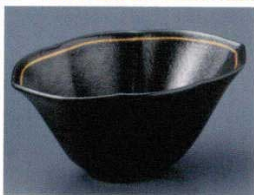
051-06-1K3 2,000円 1917046020 天目木瓜型金線珍珠入 (12×8×5.2H)