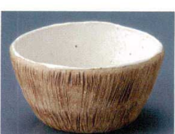
051-28-7F3 1,700円 2075054012 手造りバスケット白ボール(中) (10.9φ×5.7H)