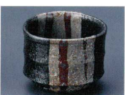
051-20-8F3 1,760円 2385051020 天目塗分姫抹茶小鉢 (9.7φ×7.8H)