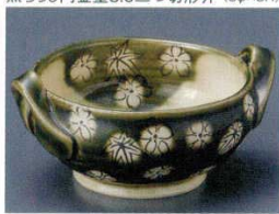
051-08-2F3 1,930円 2125086005 織部春秋両耳付4.0小付 (12.5×10.5×5.7H)