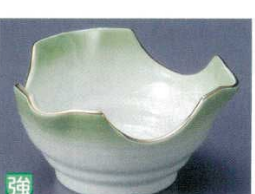
051-31-6F3 1,700円 1965046014 測金ヒワ吹小鉢 (11.3×5.8H)