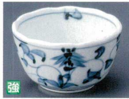
051-01-6A3 2,040円 2161061011 花唐草3.5花測井 (10.5φ×6H)