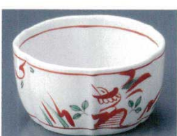
051-22-1B3 1,750円 1912045004 赤絵花鳥梅型小鉢 (10.8φ×5.7H)