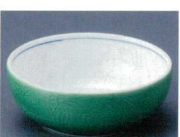
051-26-1B3 1,700円 2012055005 グリン交趾唐草彫小鉢 (10.8φ×4H)