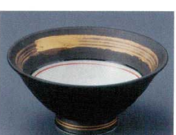
051-27-7E3 1,700円 1974044010 黒金刷毛目反小鉢 (11.5φ×5.4H)