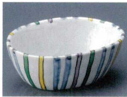
051-04-6B3 2,000円 1962043007 三色十草小判型小鉢 (12×9.3×4.4H)