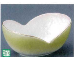
051-23-2A3 1,720円 2321051023 二色吹双葉小鉢(大) (11.59×9×5.2H) 051-24-2A3 1,450円 2321051024 二色吹双葉小鉢(小) (10×7×4H)