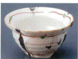
051-15-8F3 1,850円 2385051015 赤絵鉄絵楽描甲小鉢 (10.5φ×5.5H)