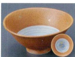
051-17-7E3 1,800円 1974044029 信楽風花文字反鉢 (11.5φ×5.3H)