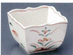
051-14-1B3 1,880円 1912044005 赤絵小花角小鉢 (8.8φ×6.2H)