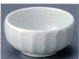
051-19-6B3 1,780円 1962036012 御深井小鉢 (11.7φ×5.2H)