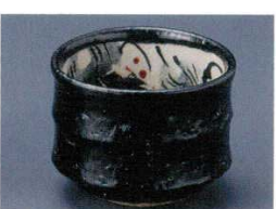
051-21-8F3 1,760円 2385051021 天目山帰来姫抹茶小鉢 (9.7φ×7.8H)