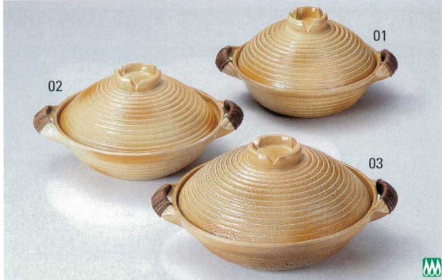
536-01-9S3 32,000円 電磁用手作り楽鍋(新幸楽)24cm (25.9φ×14H) 2099508001 536-02-9S3 33,600円 電磁用手作り楽鍋(新幸楽)27cm (28.5φ×14.5H) 2099508002 536-03-9S3 43,500円 電磁用手作り楽鍋(新幸楽)30cm (31.5φ×15H) 2099508003

和食器・小鉢・汁椀 漆器・漆塗り・漆塗り 酒器・酒器 茶器 和陶・陶器 耐熱・萬古焼 洋食器・洋食器 中華器 ガラス・金器 茶道具 雑器 木竹製品 神仏具