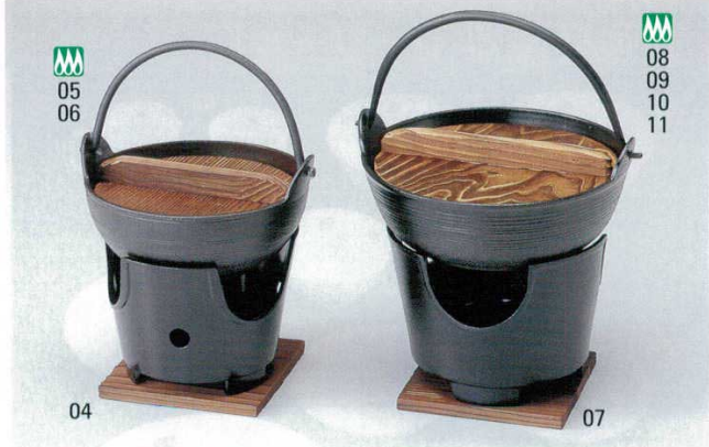
536-04-9S3 1,160円 コンロセット(小)黒 (13.5φ×9.5H) 1999642005 536-05-9S3 2,600円 いろり鍋(フッ素加工)15 (15φ×6H) 1999642006 536-06-9S3 3,300円 いろり鍋(フッ素加工)18 (18φ×6.5H) 1999642007 536-07-9S3 2,600円 コンロセット(中)黒 (14.5φ×10.5H) 1999642008 536-08-9S3 1,800円 いろり鍋(黒)15 (15φ×6H) 1999642009 536-09-9S3 2,500円 いろり鍋(黒)18 (18φ×6.5H) 1999642010 536-10-9S3 4,900円 いろり鍋(黒)21 (21φ×8H) 1999642011 536-11-9S3 6,500円 いろり鍋(黒)24 (24φ×8.5H) 1999642012