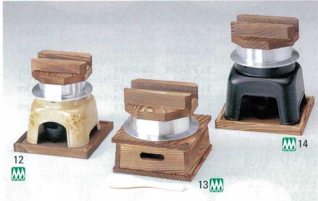
536-12-9S3 5,800円 ミニ釜飯カマド(幸楽)セット (16.5×16.5×18H) 1999642022 536-13-9S3 4,400円 ネスコ釜飯セット(飯杓子付) (16.5×16.5×15.5H) 1999642023 536-14-9S3 6,000円 釜飯カマド(セット) (149×19×21H) 1999642024