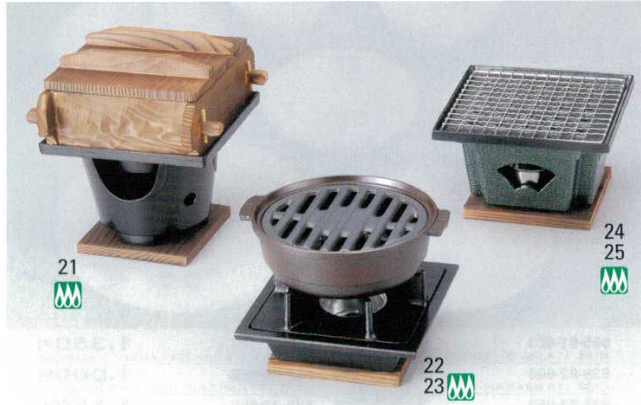
536-21-9S3 5,200円 角焼杉セイロコンロセット (17×17×19H) 1999642017 536-22-9S3 4,500円 新グリドル鍋 (17×14.7φ×5.5H) 1999642018 536-23-9S3 3,700円 四爪いろりコンロセット(小) (16×16×7.5H) 1999642019 536-24-9S3 2,800円 角コンロセット(緑いぶし) (14.5×13×8.5H) 1999642020 536-25-9S3 3,800円 焼物プレート焼網セット (16.5×16.5×1.2H) 1999642021