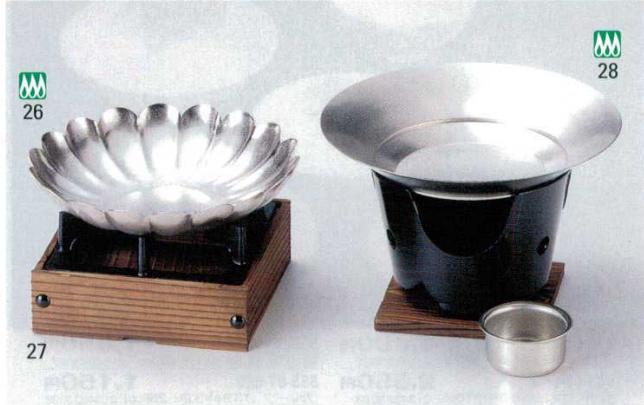
536-26-9S3 3,100円 ステン銀彩菊鉢 (18φ×3.5H) 2099508026 536-27-9S3 2,600円 焼杉コンロ足付火皿付 (14.5×14.5×6.5H) 2099508027 536-28-9S3 2,100円 ステンざざれ末広鉢 ※コンロは別売2099508028