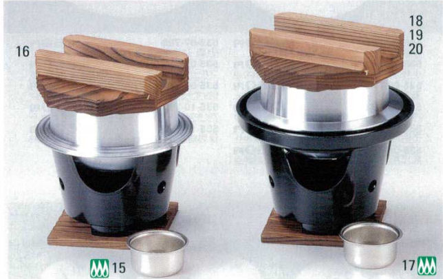
536-15-9S3 4,600円 浅釜(フッ素)コンロセット 2099508015 536-16-9S3 3,400円 浅釜(フッ素)木蓋付のみ 2099508016 536-17-9S3 6,200円 丸コンロ釜飯(フッ素)セット(フードリング付) 2099508017 536-18-9S3 3,600円 釜飯(1合)フッ素・木蓋付のみ 2099508018 536-19-9S3 1,600円 フードリングのみ 2099508019 536-20-9S3 1,160円 コンロセット(小)のみ 2099508020