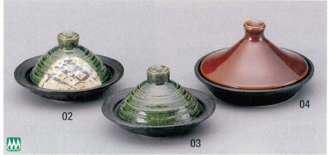
539-02-6E3 3,800円 2364539002 織部格子蓋付陶板鍋 (18.5×17.3×11H) 539-03-8F3 3,600円 2385539003 織部蓋付陶板鍋 (18.5×16.7×10.5H) 539-04-8F3 3,400円 2385539004 アメ軸20cmタジン鍋 (20.5φ×12H)