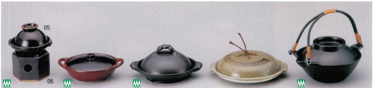
539-05-8F3 1,650円 2285541002 黒袖一品鍋 (11.8×11×7.8H) 1入 539-06-7E3 2,700円 2374539006 黒袖子六角コンロ (10×8.5×6.6H) 539-07-8F3 1,600円 2285541003 和風鍋(赤) (17.5×14.2×6H) 539-08-8F3 3,000円 2285541007 陶板鍋(黒) (19.5×16×10H) 539-09-6E3 3,600円 1934611019 美濃唐津7.0寸陶板 (19.8φ×6H) 539-10-3Y3 3,800円 1938572015 萬古焼ツル付雑炊鍋黒 (20×17φ×10.5H) 539-11-3Y3 780円 2038491025 ツルのみ (15×12.5)