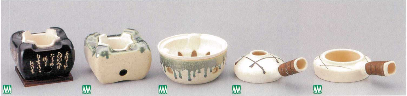
539-19-6E3 3,280円 1934611007 黒コンロ(台付) (杉板13×13-コンロ14.5×14.5×10H) 1入 539-20-8F3 3,000円 2185529006 織部流し角コンロ (14×14×9.5H) 539-21-8F3 3,300円 2185529003 織部流し丸コンロ (17φ×8.5H) 539-22-1Y3 2,600円 1918611016 萬古焼大ごま炒り (22×13) 539-23-1Y3 2,100円 1918611017 萬古焼小ごま炒り (18×11) 539-24-1Y3 2,600円 1918611018 萬古焼ほうじ器 (22×14)

別冊 急須 和陶 耐熱 洋食器 中華食器 ガラス 茶道具 雑器 木竹製品 神仏具