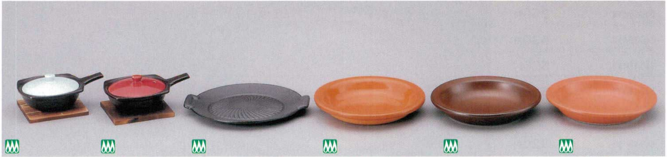
539-12-3Y3 1,750円 2338539012 萬古焼青片手目玉焼(敷板付) (15.5×11.5×6.5H) 30入 539-13-3Y3 1,750円 2338539013 萬古焼赤片手目玉焼(敷板付) (15.5×11.5×6.5H) 30入 539-14-8F3 2,300円 2385539014 黒手付23cm陶板 (22.8×19.5×2.3H) 539-15-6A3 790円 1961559018 柳川土鍋(大) (20φ×3H) 539-16-6A3 760円 1961559019 柳川土鍋(小) (15.5φ×2.5H) 539-17-6A3 2,590円 1961559014 ブラウン柳川土鍋 (20φ×3.5H) 539-18-6A3 2,590円 1961559017 柿釉柳川土鍋 (20φ×3.5H)