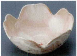
054-13-2A3 1,170円 2321054013 粉引小花花型小鉢 (11.5φ×4.7H)