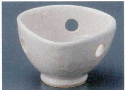
054-19-7F3 1,150円 2075044001 手造り白志野三ツ穴小鉢 (10.3φ×6H)