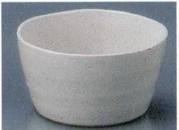
054-08-1H3 1,200円 2216055027 ブラン小鉢 (10φ×5.5H)