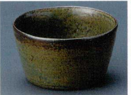
054-09-1H3 1,200円 2216055026 ピストル小鉢 (10φ×5.5H)