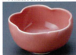
054-22-1B3 1,130円 1912049016 桃釉梅型小鉢 (8.7φ×4.6H)