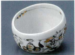
054-02-6C3 1,200円 2363054002 黒赤絵花小付 (8×3.5×5.5H)