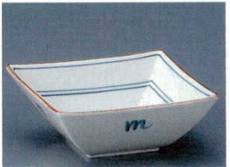
054-25-8F3 1,080円 1985048012 線文四方小鉢 (11×11×4H)