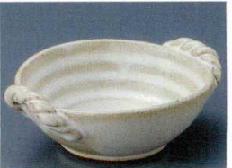
054-32-5E3 1,050円 2054044026 白唐津手付鉢(小) (13×10.3×4H)