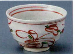
054-26-2B3 1,050円 2122067006 赤絵花鳥丸小鉢 (11.5φ×7.3H)