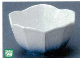
054-16-6B3 1,150円 2362054016 ルリ吹桔梗小鉢(大) (10φ×5.7H)