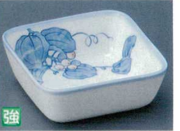
054-05-3H3 1,200円 2336054005 宴角小鉢 (9.3×9.3×3.6H)