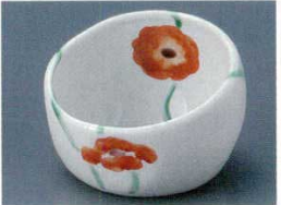
054-03-6C3 1,200円 2363054003 ホビー小付 (8×3.5×5.5H)