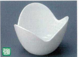
054-14-6A3 1,160円 2161065031 青白磁3.3三つ切形井 (9φ×6H)