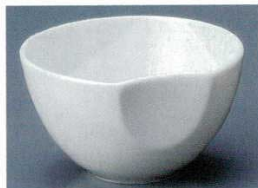
054-06-3H3 1,200円 2336054006 十六夜小鉢 (9.8×9×5.6H)