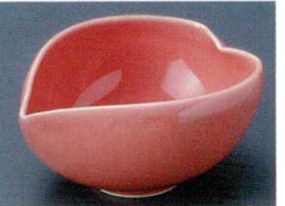
054-21-1B3 1,130円 1912066019 桃釉桜型小鉢 (9.4×8.2×4.9H)