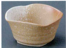
054-12-2A3 1,180円 2321054012 雪どけ4.0四方小鉢 (11.3×11.2×6H)