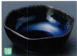
054-30-6A3 1,070円 2361054030 伊賀るり釉六方小鉢 (11φ×4.5H)