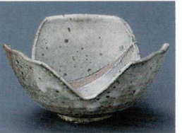
054-10-6F3 1,200円 2065056021 白マット塗り分け割山椒 (11φ×5.5H)