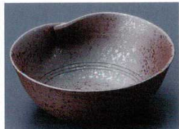
054-18-1B3 1,150円 2112066016 南蛮戸閉小鉢 (11.3×10.9×4.6H)