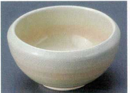
054-20-5E3 1,100円 1954049004 青菽玉測小鉢 (10φ×5.3H)