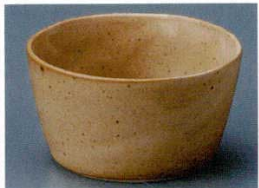
054-07-1H3 1,200円 2216055028 ロゼ小鉢 (10φ×5.5H)