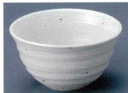
054-11-2B3 1,150円 2322054011 うるし白小鉢 (11φ×5.8H) 120入