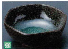
054-29-6A3 1,070円 2161066017 新緑ビードロ六方小鉢 (11φ×4.5H)