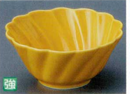
054-04-8F3 1,200円 2385054004 菊精円小鉢 (10×9.8×4.5H)