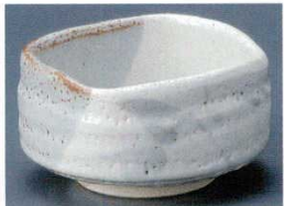
054-24-2B3 1,100円 2222057027 志野カヤ四角4.0小鉢 (11×11×6H)