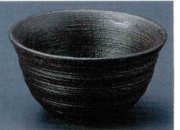
054-15-2B3 1,150円 2322054015 うるし黒小鉢 (11φ×5.8H) 120入