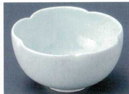
054-23-1B3 1,130円 1912049015 青磁梅型小鉢 (8.7φ×4.6H)