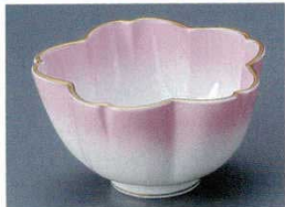
054-01-6A3 1,210円 2161065005 ピンク吹口金3.0桜形井 (9×8.5×5H)

刺身・向付小鉢・珍味 湯加・湯皿・大皿・鉢 湯徳・湯碗・茶臼 井・茶碗 急須・茶器 和陶・オーブン 耐熱・重古焼 洋食器・碗皿 中華食器 ガラス・金属 茶道具 雑器 木竹製品 神・仏具