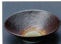
054-27-1B3 1,140円 2312054027 鉄仙花ヒワ石目丸小鉢(大) (11.3φ×3.4H)