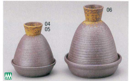
551-04-3Y3 3,700円 2138545014 焼締タジン鍋(φ16)1人用 (16.5φ×18H) 551-05-3Y3 7,200円 2138545015 焼締タジン鍋(φ20)2人用 (20.5φ×24H) 551-06-3Y3 12,500円 2138545016 焼締タジン鍋(φ25)3~4人用 (25φ×26H)