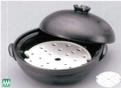
551-12-1Y3 6,500円 黒むし器鍋8号(サナ付) (28φ×16H) 2318551012 551-13-1Y3 8,300円 黒むし器鍋9号(サナ付) (33×28.5×18H) 2318551013 551-14-1Y3 2,000円 黒むし器9号用サナ (20φ) 2318551014 551-15-1Y3 2,500円 黒むし器9号用サナ (22φ) 2318551015