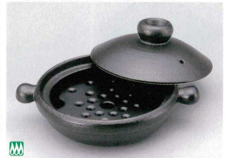
551-10-6Y3 4,800円 2368551010 黒マット7号蒸し鍋(すのこ付) (28×21×12H・900cc) 1人 551-11-6Y3 1,200円 2368551011 7号蒸し鍋すのこ (14φ×2H) 1人