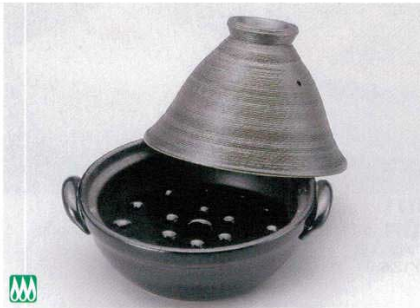
551-07-3Y3 9,500円 2338551007 鍋道楽7.5号蒸し鍋(中子付) (26×23φ×20.5H)