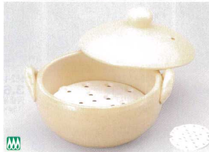
551-16-1Y3 5,700円 2118546017 黄むし鍋(大)(サナ付) (25×21φ×17H) 551-17-1Y3 1,300円 2118546018 黄むし鍋(大)用サナ (17.5φ)