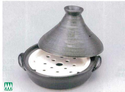
551-08-3Y3 9,800円 2338551008 蒸きげん蒸し鍋8号(中子付) (28×25φ×19.5H) 551-09-3Y3 14,000円 2338551009 蒸きげん蒸し鍋10号(中子付) (34×30.5φ×21.5H)