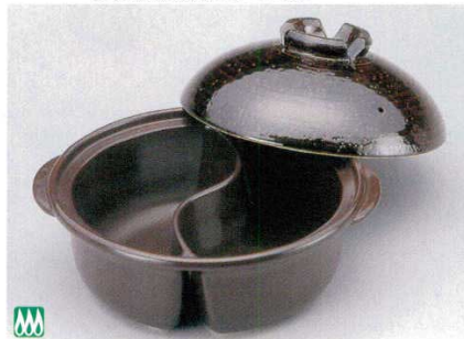
551-22-3Y3 6,600円 2238554020 灰釉9号仕切鍋 (31×28φ×18H) 6入