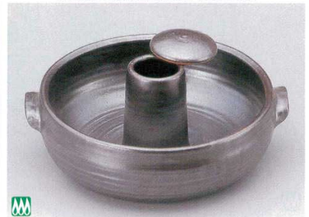
551-23-3Y3 9,000円 2238554023 鉄結晶しゃぶしゃぶ鍋 (29×26.5φ×13H)

陶器 土器 磁器 耐熱 萬古焼 洋食器 中華食器 カフス 釜道具 雑器 木竹製品 神仏具