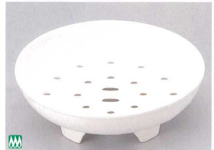
551-18-3Y3 1,800円 2338551018 大黒蒸し鍋専用高台皿7号 (18φ×5.5H) 551-19-3Y3 2,700円 2338551019 大黒蒸し鍋専用高台皿8号 (21φ×6.2H) 551-20-3Y3 3,400円 2338551020 大黒蒸し鍋専用高台皿9号 (23φ×7.5H)