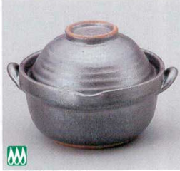
552-02-3Y3 2,850円 2138547010 鉄結晶碗付雑炊鍋 (15.5φ×13H)