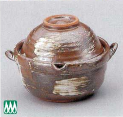
552-01-3Y3 2,850円 2138547009 唐津刷毛目碗付雑炊鍋 (15.5φ×13H)

和食器 土器・陶器 雑炊鍋 急須 茶器 和陶 耐熱・萬古焼 洋食器・碗皿 中華食器 カラダ 金銀 茶道具 漆器 木竹製品 神仏具