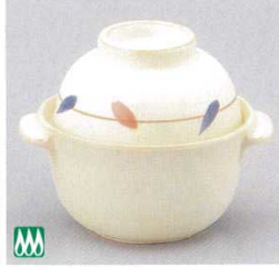
552-03-3Y3 2,100円 1938572010 むさしの碗付雑炊鍋 (16.5×14φ×13H)