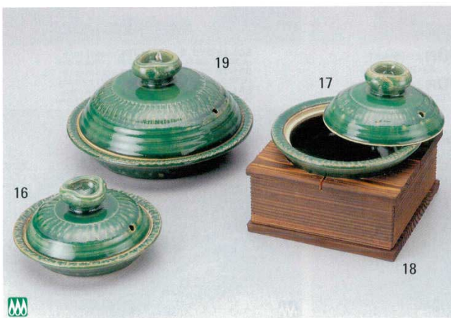
552-16-3Y3 5,500円 織部(手造り)5号陶板 (16.5φ×9.5H) 20入 2338552016 552-17-3Y3 6,300円 織部(手造り)5号鍋 (16.5φ×12H) 20入 2338552017 552-18-3Y3 3,400円 がんじょう釜台(小) (17.5×17.5×8H) 2338552018 552-19-3Y3 9,500円 織部(手造り)7.5号丸鍋 (23φ×11.5H) 10入 2338552019