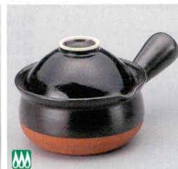
552-14-3Y3 3,600円 1938573004 天目碗付行平 (15φ×12.5H)