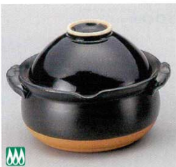
552-06-3Y3 3,200円 1938573003 天目碗付雑炊鍋 (17×15φ×12H)