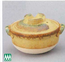
552-09-3Y3 2,800円 1938572020 利行ハケメ雑炊鍋 (20×17φ×12.5H)