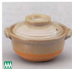
552-13-3Y3 3,200円 1938573010 京風白刷毛目雑炊鍋 (19.5×17φ×12.5H)