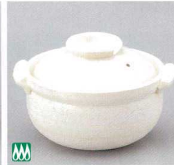
552-10-3Y3 2,600円 1938572018 白ハケメ雑炊鍋 (20×17.5φ×13H)