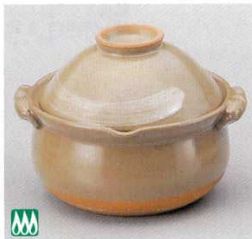
552-07-3Y3 3,200円 1938573008 京風白刷毛目碗付雑炊鍋 (17×15φ×12.5H)