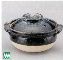
552-08-3Y3 2,800円 1938572019 瑠璃釉雑炊鍋 (20×17φ×12.5H)