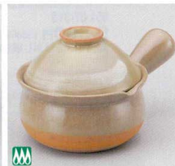
552-15-3Y3 3,600円 1938573009 京風白刷毛目碗付行平 (15φ×12.5H)