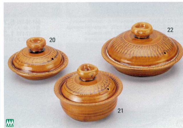
552-20-3Y3 5,500円 アメ釉(手造り)5号陶板 (16.5φ×9.5H) 20入 2338552020 552-21-3Y3 6,300円 アメ釉(手造り)5号鍋 (16.5φ×12H) 20入 2338552021 552-22-3Y3 9,500円 アメ釉(手造り)7.5号丸鍋 (23φ×11.5H) 10入 2338552022