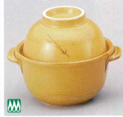
552-04-3Y3 2,100円 1938572009 松葉碗付雑炊鍋 (16.5×14φ×13H)