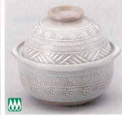
552-05-1Y3 2,300円 1918572005 三島雑炊鍋 (17×15φ×13H)