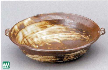
558-01-3Y3 4,200円 2138553014 唐津刷毛目(手造り)耐熱ボール(大) (25.5φ×7H) 558-02-3Y3 3,000円 2138553013 唐津刷毛目(手造り)耐熱ボール(小) (21.5φ×6H)

刺身向小鉢 和陶オーブン 耐熱・萬古焼 洋食器・碗皿 中華食器 カフス・金属 茶道具 鉢器 木・竹製品 神・仏具