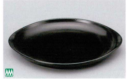
558-08-1Y3 2,800円 2118533020 黒会席27cm丸プレート (29×27×3H) 558-09-1Y3 1,800円 2118533019 黒会席22cm丸プレート (23.5×22×3H)