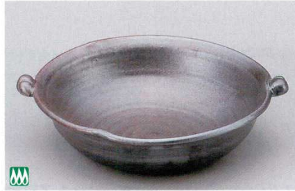
558-03-3Y3 4,200円 2138553016 鉄結晶(手造り)耐熱ボール(大) (25.5φ×7H) 558-04-3Y3 3,000円 2138553015 鉄結晶(手造り)耐熱ボール(小) (21.5φ×6H)