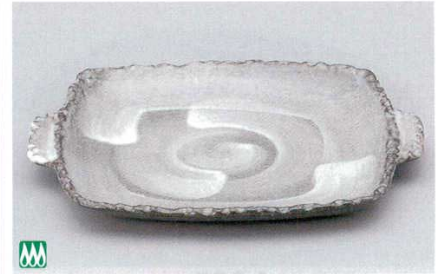
558-22-1Y3 4,100円 2118532013 森乃刷毛目10.0スクエア皿 (35×30.5×3H) 558-23-1Y3 2,600円 2118532012 森乃刷毛目8.0スクエア皿 (35×16.5×3H)