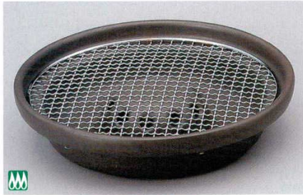
558-06-1Y3 5,400円 2118545001 炎旨焼器アミ付き (29φ×7H)