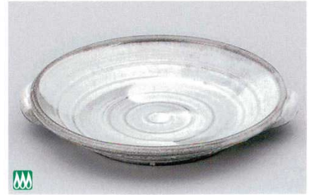
558-15-1Y3 4,200円 2118532014 森乃刷毛目10.0手付陶板 (34×29.5×4.5H) 558-16-1Y3 3,200円 2118532015 森乃刷毛目9.0手付陶板 (30.5×27×4.5H) 558-17-1Y3 1,750円 2118532016 森乃刷毛目7.0手付陶板 (24×21×3.5H)