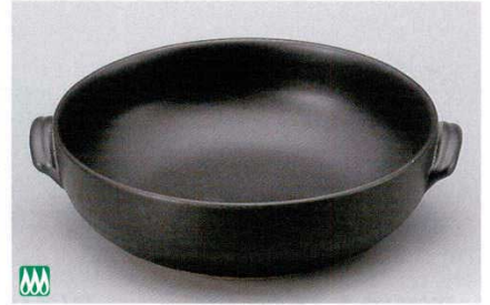
558-05-1Y3 3,500円 2318558005 黒すき焼き鍋8号 (27×23.7×7.5H)