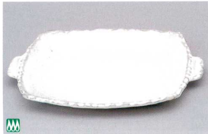
558-18-3Y3 4,200円 2138670008 ホワイトスクエア皿10号 (34.5×30.5×2.5H) 558-19-3Y3 2,600円 2138670009 ホワイトスクエア皿8号 (28.3×24.5×2.5H)