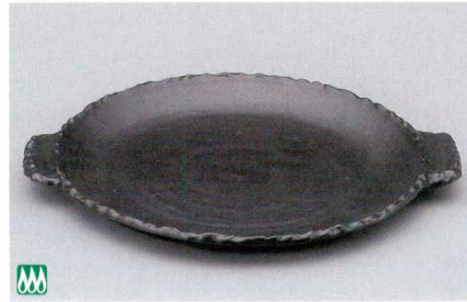
558-11-1Y3 3,900円 黒会席10.0/バスタ皿 (34.5×29.5×3.5H) 2118533024 558-12-1Y3 2,400円 黒会席9.0/バスタ皿 (31×27.5×3.5H) 2118533023 558-13-1Y3 2,200円 黒会席8.0/バスタ皿 (29×25×2.5H) 2118533022 558-14-1Y3 1,600円 黒会席7.0/バスタ皿 (24.5×21×2H) 2118533021