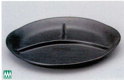
558-10-1Y3 2,200円 2318558010 黒モーニングプレート三つ仕切り (27.5×26×3H)