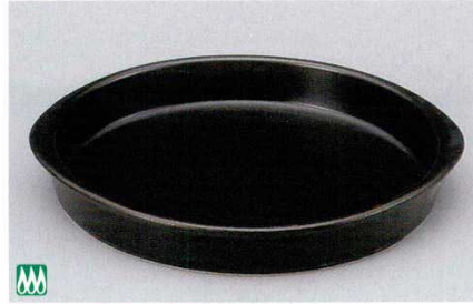
558-07-1Y3 2,600円 2118533015 黒会席バイプレート (27×25×3.5H)