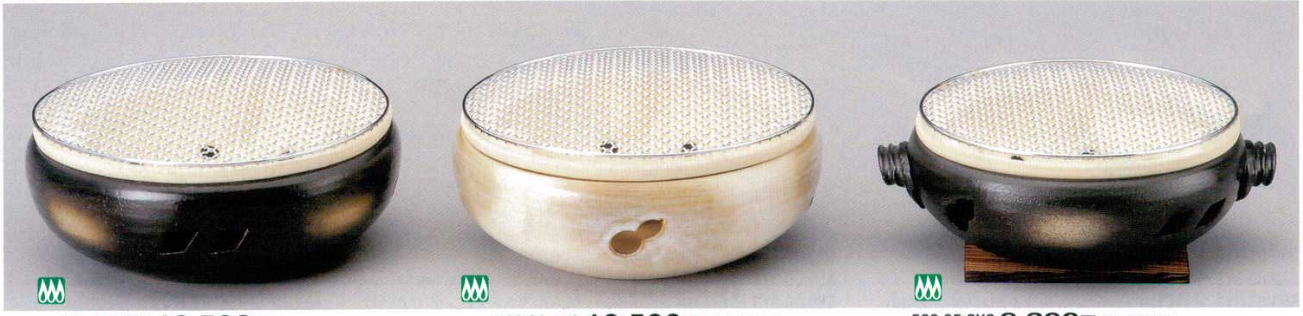
560-01-1Y3 10,500円 1918579007 黒10.0伊勢コンロ (30φ×12H) 560-02-1Y3 6,800円 1918579006 黒7.0伊勢コンロ (20φ×10H) 560-03-1Y3 10,500円 1918579005 志野10.0伊勢コンロ (30φ×12H) 560-04-1Y3 6,800円 1918579004 志野7.0伊勢コンロ (20φ×10H) 560-05-3Y3 9,300円 1938579003 伊勢コンロ9号手付(金網・敷板付) (32×27φ×11H) 560-06-3Y3 2,700円 2038503030 伊勢コンロ9号用五徳 (26.7φ×7.8H) 560-07-3Y3 1,800円 2038503031 伊勢コンロ9号用金網 (26φ)

利身内付 火鉢 急須 茶器 和陶 オーブン 耐熱 高古焼 洋食器 碗皿 中華食器 ガラス 金属 茶道具 雑器 木・竹製品 神・仏具