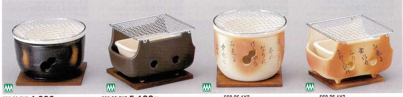
560-20-3Y3 4,600円 1938579002 伊勢コンロ5号(金網・敷板付) (17φ×12.5H) 560-21-3Y3 1,350円 2038503028 伊勢コンロ5号用金網 (17φ) 560-22-3Y3 980円 2038503027 伊勢コンロ5号用五徳 (16.7φ×6.5H) 560-23-3Y3 5,100円 2238562024 黒串焼きコンロ(小)(金網・板付) (18.3×14×11.5H) 560-24-3Y3 1,400円 2238562025 串焼きコンロ(小)用金網 (15×15) 560-25-1Y3 4,600円 1918579009 万葉ミニ丸コンロ (17φ×13H) 560-26-1Y3 5,100円 1918579008 万葉角小コンロ (18×15×12H)