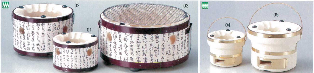
563-01-1Y3 4,200円 1918578001 15cm大臣コンロ (15φ×10H)