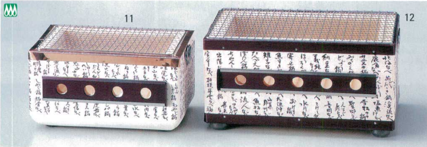
563-11-1Y3 11,000円 1918578010 焼肉コンロ アミ付 (27×17×15H)