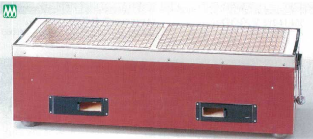
563-14-1Y3 35,000円 1918578013 特大バーベキュー アミ付 (60×25×18H)