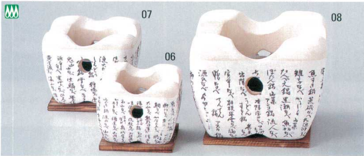
563-06-1Y3 3,000円 1918578006 12cm民芸コンロ(敷板付) (12×12×10H)