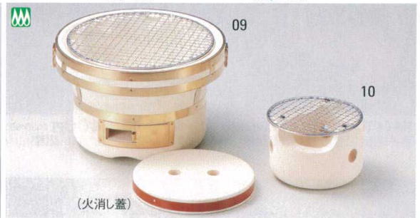
563-09-1Y3 15,600円 1918578009 ひまわりコンロ アミ付(火消し蓋) (27φ×17H)