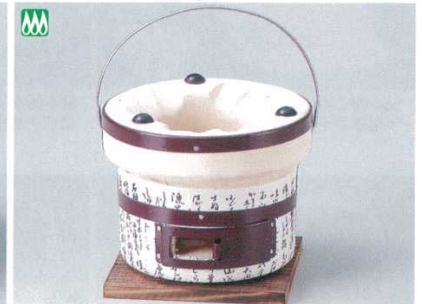
563-13-1Y3 6,000円 1918578012 朝顔コンロ(敷板付) (15φ×13H)