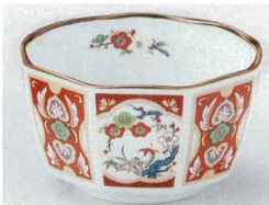
058-19-2B3 780円 1922052006 錦伊万里八角小鉢 (10×10×5.7H)