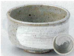
058-15-3C3 780円 2033061002 唐津白化粧抹茶小鉢 (10.3φ×6H)