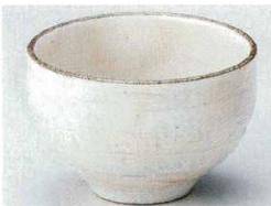
058-17-3C3 780円 2133071004 桃山粉引丸鉢 (10.2φ×6.6H)