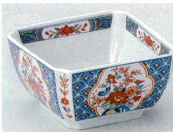
058-22-1K3 770円 1917054011 京花錦角小鉢 (9.7×9.7×5.5H)