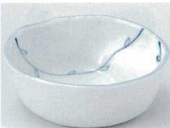
058-02-2F3 800円 2025059018 若芽結び小鉢 (10.5φ×4H)