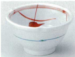
058-33-3A3 780円 2131068040 三輪花内赤絵4.0小鉢 (11.2φ×6.3H) 058-34-3A3 640円 2131068041 三輪花内赤絵3.5小鉢 (10.8φ×6.3H) 058-35-3A3 550円 2131068042 三輪花内赤絵3.0小鉢 (9.5φ×5.7H)