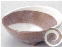
058-20-5E3 780円 2254063014 ネリ込三つ足小鉢 (11.5φ×4.5H)