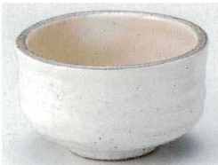
058-14-3C3 780円 2033061003 桃山粉引抹茶小鉢 (10.3φ×6H)