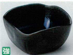
058-01-6A3 810円 2361058001 伊賀るり釉3.6角小鉢 (9×9×5H)