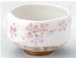
058-13-3B3 780円 2132069030 平安桜丸小鉢 (9.5φ×6.5H)