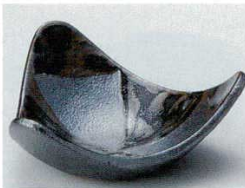
058-24-2A3 800円 2121068025 黒志野三角小鉢(大) (11.2φ×4H) 058-25-2A3 580円 2121068026 黒志野三角小鉢(小) (9.4φ×4H)