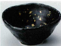
058-03-7F3 800円 2075059006 金箔吹き三角小鉢 (10.8×10.8×5.3H)