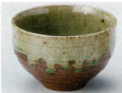
058-18-3C3 780円 2233064005 緑流丸鉢 (10.2φ×6.6H)