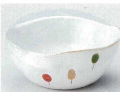
058-09-6H3 790円 2266062011 白袖風船3.8丸小鉢 (11.5φ×4.8H)