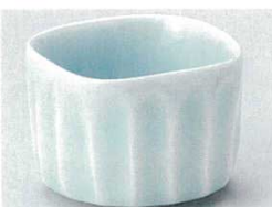
058-07-5E3 790円 2354058007 青白磁削四角小鉢 (7.2×7.2×5.3H)