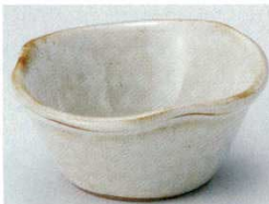
058-30-4B3 800円 2042047029 かすみの三つ押小鉢(大) (11.5×5.5H) 中皿 058-31-4B3 580円 2042047030 かすみの三つ押小鉢(中) (9.5×4.5H) 中皿 058-32-4B3 450円 2042047031 かすみの三つ押小鉢(小) (8×4H) 中皿