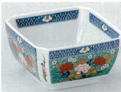
058-23-1K3 770円 2017061014 グリーンボタン角小鉢 (9.7×9.7×5.5H)