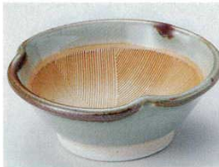
058-38-6C3 740円 2363058038 貫入ヒワ花型4.0すり小鉢 (12φ×4.5H) 058-39-6C3 700円 2363058039 貫入ヒワ花型3.2すり小鉢 (10φ×3.8H)