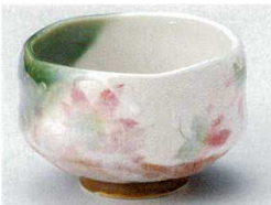
058-12-3B3 780円 2132069031 織部春秋丸小鉢 (9.5φ×6.5H)