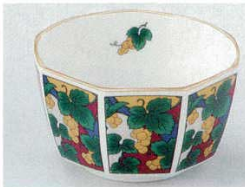
058-36-1B3 760円 1912052004 金ぶどう八角小鉢(大) (10.4φ×6H) 058-37-1B3 670円 1912052005 金ぶどう八角小鉢(小) (8.4φ×5.6H)