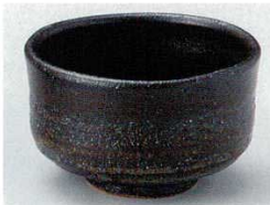
058-16-3C3 780円 2033061001 鉄彩釉抹茶小鉢 (10.3φ×6H)