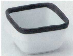
058-40-2B3 750円 2322058040 桃山(石目)四角小鉢(大) (9×9×5.8H) 120入 058-41-2B3 600円 2322058041 桃山(石目)四角小鉢(小) (8×8×5.8H) 120入