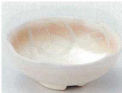
058-21-6E3 780円 2364058021 御本手木ノ葉花形小附 (9.7φ×3.6H)