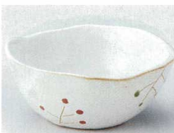
058-10-6H3 790円 2266062012 白袖木の葉3.8丸小鉢 (11.5φ×4.8H)