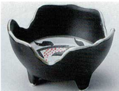
058-04-6F3 800円 1965051007 唐草三つ足小鉢 (11.3φ×5.2H)