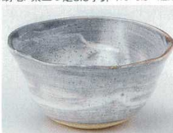
058-11-4B3 780円 2042059010 黒粉引花型小鉢 (11φ×5.5H)