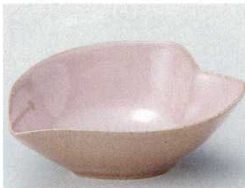
058-26-6B3 800円 2262061012 桜花びら小鉢(大) (13×11.5×4.3H) 058-27-6B3 690円 2262061013 桜花びら小鉢(小) (10.2×8.7×3H)