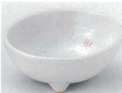
058-05-2A3 800円 2121052023 刷毛目楽三つ足4.0小鉢 (12.1×11.4×4.8H) 058-06-2A3 680円 2221063024 刷毛目楽三つ足3.3小鉢 (10×9.3×4.2H)