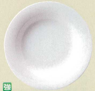
強 642-10-2H3 800円 2326642010 Tライト9吋スープ (23.2φ×3.4H)