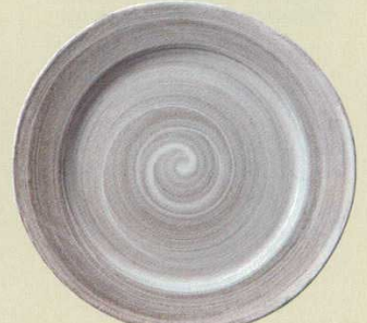
642-26-1A3 2,380円 2211673008 刷毛目27リム皿 (27×25.8×2.1H) 642-27-1A3 1,660円 2211673009 刷毛目21リム皿 (21×20×2H)