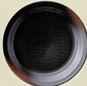
642-25-1B3 3,600円 2312642025 焼締パスター皿 (26.4φ×3.8H)