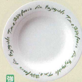
強 642-09-2H3 920円 2326642009 グリーンリーフトライト9吋スープ (23.2φ×3.4H)