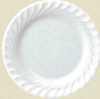
642-11-8F3 4,000円 2385642011 シルキーウェーブ12吋皿 (31.5φ×3.5H) 642-12-8F3 1,900円 2385642012 シルキーウェーブ10吋皿 (26φ×2.5H) 642-13-8F3 1,150円 2385642013 シルキーウェーブ9吋皿 (23.5φ×2.2H) 642-14-8F3 800円 2385642014 シルキーウェーブ7.5吋皿 (21φ×2H) 642-15-8F3 600円 2385642015 シルキーウェーブ6.5吋皿 (17φ×2H)