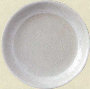
642-01-7E3 2,580円 2374642001 白波深口パスタ皿 (25.7φ×4.3H)

和食・小鉢・汁椀 和食・和皿・和鉢・和鉢 酒器・蓋碗・茶碗 丼・茶碗 急須・茶器 和陶・オーブ 耐熱・萬古焼 洋食器・碗皿 中華食器 ガラス・金属 茶道具 雑器 木・竹製品 神・仏具