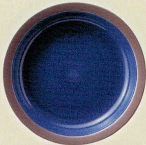
642-07-6F3 1,200円 1965510007 ラーゴカレースパゲティボール (22.3φ×4H)