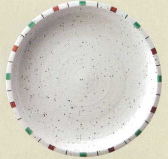
642-06-5E3 1,750円 1954470004 赤絵十草パスタ皿 (24.8φ×3H)