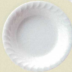
642-16-8F3 1,350円 2385642016 シルキーウェーブ9吋スープ (23φ×4H) 642-17-8F3 1,000円 2385642017 シルキーウェーブ7.5吋クープ (19φ×4H) 642-18-8F3 900円 2385642018 シルキーウェーブ6.5吋オートミル (16.5φ×4H) 642-19-8F3 600円 2385642019 シルキーウェーブ5.5吋フルーツ (14.5φ×3.5H)