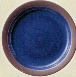
642-03-6F3 2,000円 1965510003 ラーゴ10吋デザイナー (27φ×3.5H) 642-04-6F3 1,280円 1965510002 ラーゴ9吋ミート (23.7φ×3.3H) 642-05-6F3 870円 1965510001 ラーゴ7 1/2吋ケーキ (19φ×3H)