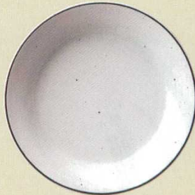
642-23-7E3 1,000円 2074594044 サーブル7 1/2吋クープ (19φ×4.5H) 642-24-7E3 660円 2074594043 サーブル5 1/2吋フルーツ (14φ×3.5H)