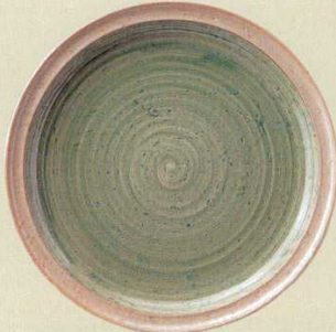
642-02-2A3 2,350円 1921469012 グリーンパスタ皿 (24.3φ×3.3H)