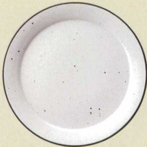
642-20-7E3 1,200円 2074594033 サーブル9吋ミート (23φ×2.3H) 642-21-7E3 840円 2074594032 サーブル7 1/2吋ミート (19.3φ×2H) 642-22-7E3 660円 2074594031 サーブル6 1/2吋ミート (16.7φ×1.5H)