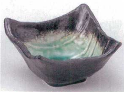
065-18-2B3 450円 2322065018 深海グリーン四角小鉢(中) (10.3×10.3×5.5H) 120