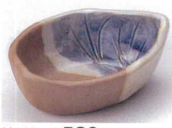
065-06-1B3 520円 1912059025 南蛮染付スキ小鉢 (11.2×8.4×3.4H)