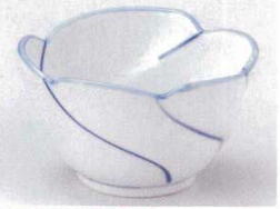
065-28-2B3 400円 2022067028 粉引ライン四角小鉢(小) (8.5×8.5×4.5H)