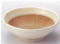
065-02-2B3 520円 2222069025 白マット3.6スリ平小鉢 (11.8×11.5×4.3H)