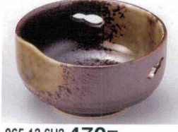
065-13-6H3 470円 2166057002 南蛮透かし小鉢 (11.5φ×6H)