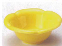
065-04-1B3 520円 1912057005 黄釉朝顔型小鉢 (11φ×4.4H)