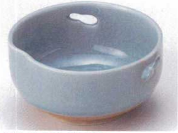
065-16-6C3 450円 1963057026 ヒスイ貫入瓢抜小鉢 (11.5φ×6H)