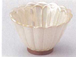
065-10-8F3 500円 1985057013 浜茶ラスタ-丸菊小鉢 (9.5φ×5.8H)