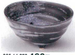
065-14-8F3 460円 2385065014 黒潮三足楕円鉢 (11.2×9.4×5.6H)