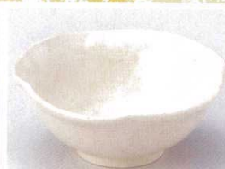
065-05-3C3 520円 1933058016 白志野花小鉢 (12φ×5H)