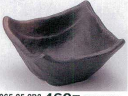
065-23-2A3 470円 2021050028 半掛マユ型3.5井 (10×9.5×6.5H)