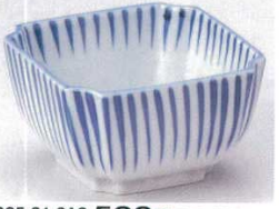
065-26-2B3 400円 2222070032 黒備前四角小鉢(小) (8.6×8.6×4.7H)