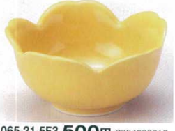
065-21-5E3 500円 2254069013 山吹釉花型小鉢(大) (11φ×5.2H)