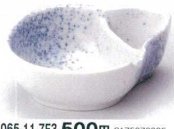
065-11-7F3 500円 2175076005 吹スミひさご仕切小鉢 (11.8×9.8×3.8H)