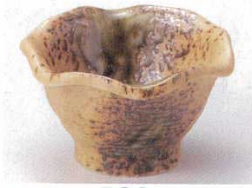
065-07-2K3 520円 1927057018 織部伊賀花型小鉢 (10φ×5.5H)