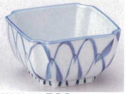
065-27-2B3 460円 2022067027 粉引ライン四角小鉢(大) (10×10×5.5H)