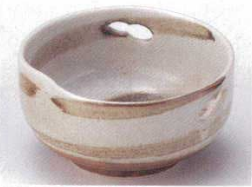
065-17-6C3 450円 2363065017 唐津渦瓢抜小鉢 (11.5φ×6H)