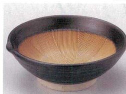
065-03-2B3 520円 2222069024 黒マット3.6スリ平小鉢 (11.8×11.5×4.3H)