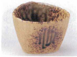
065-08-2K3 520円 1927056028 織部伊賀小鉢 (8.6φ×6.3H)