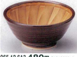
065-12-6A3 480円 2161056013 外錆クシメ3.8すり鉢深井 (12φ×5.5H)