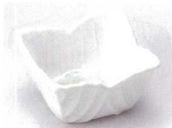
065-01-6A3 520円 1961069019 白マット3.0葉型角井 (8×8×4H)

刺身 向付小鉢 珍味 和風和洋 和洋 酒肴 茶感 茶 井茶 茶碗 急須 茶器 和風 オーブン 耐熱 萬古 洋食器 碗皿 中華 食器 ガラス 金属 茶道具 雑器 木竹 製品 神 仏具