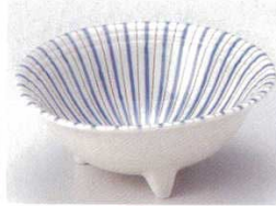
065-09-6B3 500円 2262068015 京十草足付3.8鉢 (12×11.5×5H)