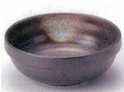
065-19-6H3 450円 2366065019 白吹天目スタック小鉢 (11.8φ×4.5H)