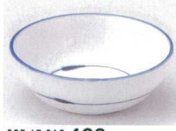
065-15-6A3 460円 2261069027 一本筋 3.3丸井 (10φ×3.5H)