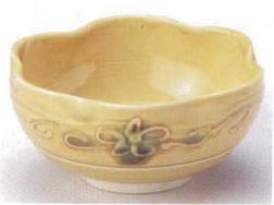
065-29-6C3 450円 1963057034 ヒワ貫入瓢形小鉢(大) (11.5×11×5H)