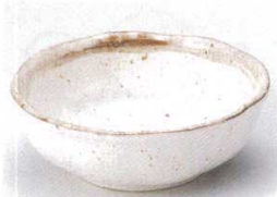
067-06-4E3 400円 2044165023 白唐津3.6小鉢 (12.5φ×4.2H)