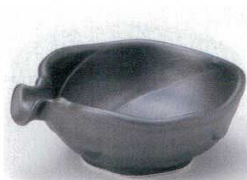
067-16-3B3 400円 2123058004 黒マット片口小鉢 (12.3×11×4.5H)