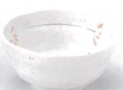
067-36-1E3 390円 2214071032 花唐草3.8小鉢 (12.2φ×5.7H)