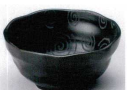
067-30-1E3 390円 2314067030 黒マットラズ3.8小鉢 (12φ×5.7H)