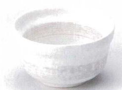
067-03-8F3 400円 2385067003 粉引刷毛目四つ押小鉢 (10φ×6H)