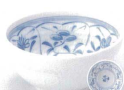
067-39-4E3 380円 1944060049 トチリナスナ3.8小鉢 (11.7φ×5.5H)