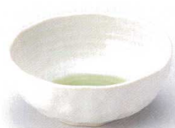
067-09-5E3 400円 2354067009 うのふグリーン亀甲4.0ボール (11.6φ×4.5H)