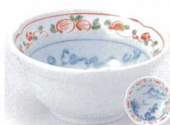
067-05-2C3 400円 2123078031 赤絵山水3.3小鉢 (10.8φ×5.3H)