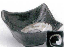
067-13-4E3 400円 2044067022 黒結晶ハケメ角鉢(大) (10×10×5.5H)