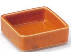
067-19-6A3 400円 2161079022 オレンジ3.0角形井 (8.5×8.5×3H)