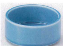
067-29-8F3 380円 2185092005 トルコ重ね鉢 (8.3φ×4H)