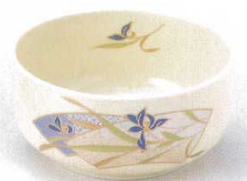
067-08-1H3 400円 2316067008 花扇クリーム小鉢 (10.9φ×5.4H)