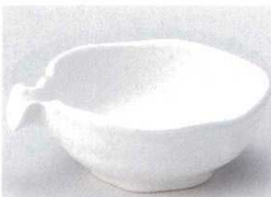
067-14-3B3 400円 2123058005 白マット片口小鉢 (12.3×11×4.5H)