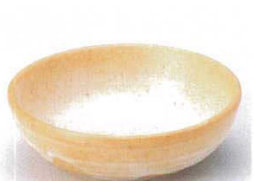
067-23-6B3 400円 2362067023 志野丸鉢(小) (9.5φ×3H)