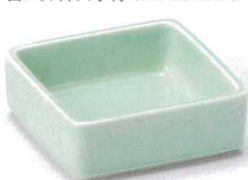
067-21-6A3 400円 2161079025 グリーン3.0角形井 (8.5×8.5×3H)