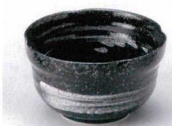
067-04-8F3 400円 2385067004 黒水晶刷毛目四つ押小鉢 (10φ×6H)