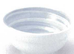
067-42-1E3 370円 2314067042 ブルー巻3.8小鉢 (12φ×5.7H)