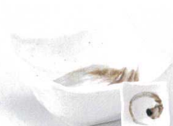
067-12-4E3 400円 2044067021 白マット水晶ハケメ角鉢(大) (10×10×5.5H)