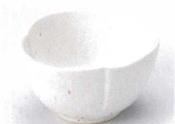
067-11-5E3 400円 2054067010 白釉三ツ折9cm小鉢 (9.3φ×5.3H)