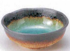
067-07-4E3 400円 1944151016 緑彩3.6小鉢 (12.3φ×4.3H)