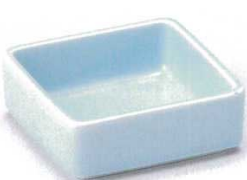
067-20-6A3 400円 2161079024 トルコ3.0角形井 (8.5×8.5×3H)