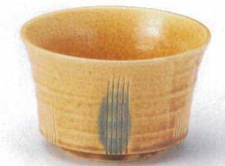
067-02-6C3 410円 2363067002 伊羅保反小鉢 (9.8φ×6H)