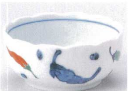
067-18-4E3 400円 2044067004 錦とうがらし花型小鉢 (11φ×5H)