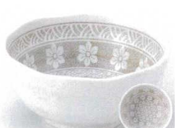
067-24-6E3 380円 2264072034 三島3.8小鉢 (12φ×5.6H)