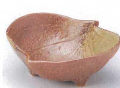
067-10-4E3 400円 2244070030 山帰来備前小鉢 (10.5×10×4H)