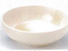
068-28-1H3 300円 2216072021 たくみ3.8小鉢 (12φ×4H)