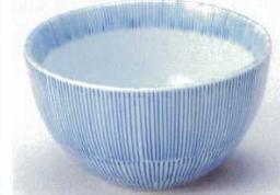
068-29-4B3 330円 2142059007 京十草3.5マルチボール (11φ×6.3H)