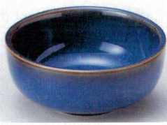
068-27-8F3 300円 2385068027 ルリ3.5ボール (10.5φ×3.5H)