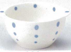
068-19-4B3 320円 2242071028 マツ水玉手付小鉢 (11.2×10×5.5H)