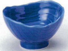
068-05-6A3 370円 2161079003 ルリ3.0木目小鉢 (9×8.5×5.5H)