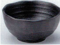
068-37-6E3 280円 2264073018 いぶし3.5小鉢 (10.8φ×5.4H)