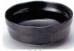
068-13-6E3 320円 2364068013 スタック鉢ブラック (10.8φ×4.3H) 80入