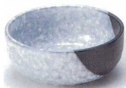
068-07-8F3 380円 2285071021 淡雪3.6ボール (10.3φ×4.3H) 068-08-8F3 240円 2285072020 淡雪2.8ボール (8.2φ×3.7H)