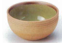
068-24-1E3 320円 1914071024 ヒワ3.0ボール (9φ×4.8H)