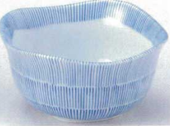
068-33-4B3 300円 2142059015 京十草3.8角小鉢 (11×11×6H)