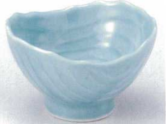
068-04-6A3 370円 2161079005 グリーン3.0木目小鉢 (9×8.5×5.5H)