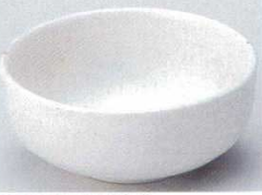
068-26-8F3 300円 2385068026 粉引3.5ボール (10.5φ×3.5H)