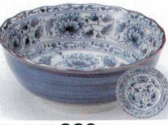
068-14-5E3 320円 2354068014 古染牡丹波形3.8鉢 (11.8φ×4.3H)