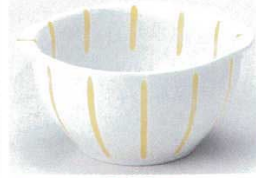
068-18-4B3 320円 2242071026 十草手付小鉢 (11.2×10×5.5H)