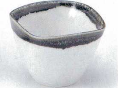
068-10-5E3 330円 1954071022 瀏グリーン角深小鉢 (8×8×6H)