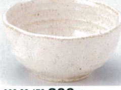
068-22-4E3 300円 2344068022 うのふ3.5小鉢 (10.8φ×5.4H) 068-23-4E3 240円 2344068023 うのふ3.0小鉢 (9.6φ×4.7H)