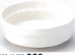
068-16-6E3 320円 2364068016 スタック鉢ニューボン (10.8φ×4.3H) 80入