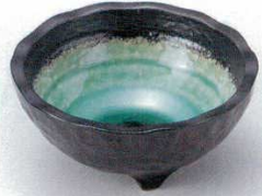
068-06-2B3 350円 2322068006 深海グリーン3.5三ツ足小鉢 (10.5φ×5H) 120入