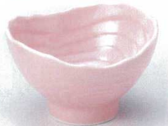
068-03-6A3 370円 2161079002 ピンク3.0木目小鉢 (9×8.5×5.5H)