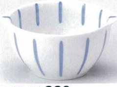
068-21-4B3 320円 2242071025 十草手付小鉢 (11.2×10×5.5H)