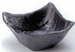
068-01-6E3 400円 2264070033 南蛮白雪四角小鉢(中) (10×10×5.2H) 068-02-6E3 350円 2264070034 南蛮白雪四角小鉢(小) (8.5×8.5×4.7H)