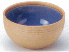
068-25-1E3 320円 1914071023 ルリ3.0ボール (9φ×4.8H)