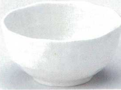
068-35-4E3 300円 2144081013 灰マツ3.5小鉢 (10.8φ×5.4H)