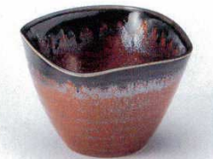
068-09-5E3 330円 1954071021 朱赤角深小鉢 (8×8×6H)