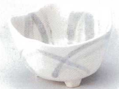
068-11-5E3 340円 2054048034 ゆらぎ五角小鉢(小) (9.6×9.4×5.5H)