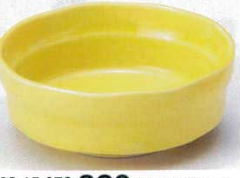
068-15-6E3 320円 2364068015 スタック鉢イエロー (10.8φ×4.3H) 80入