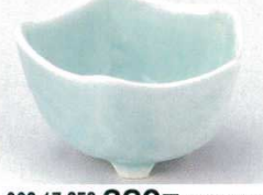
068-17-8F3 320円 2285072013 青磁五角小鉢(小) (9.3φ×5.5H)