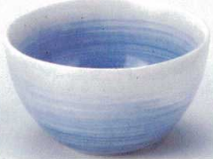
068-31-4B3 330円 2142059009 青刷毛3.5マルチボール (11φ×6.3H)