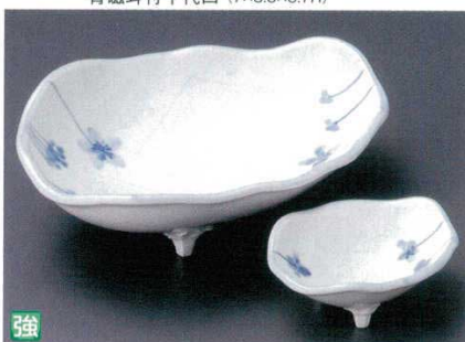
007-11-2A3 2,770円 2321007011 青磁花画刺身鉢 (18.8×14×5.5H) 007-12-2A3 1,160円 2321007012 青磁花画千代口 (9.3×7.5×3.5H)