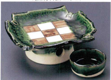
007-15-7F3 2,800円 2075005005 織部市松高台向付 (16.7×14.7×6H) 007-16-7F3 670円 2075005006 織部ケタ彫丸千代口 (7φ×3.2H)