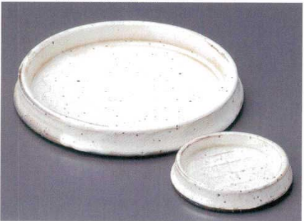
007-19-7E3 2,750円 2274008007 粉引ソギ切立向付 (15φ×2H) 007-20-7E3 1,150円 2274008008 粉引ソギ千代口 (7.8φ×1.5H)