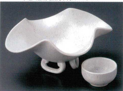
007-23-8F3 2,750円 2385007023 ラスター(白)四つ山向付 (20×15×8.3H) 007-24-8F3 760円 2385007024 ラスター(白)丸千代口 (6.2φ×3.2H)