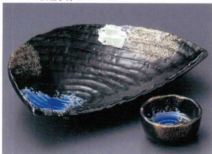
007-07-7F3 2,800円 2075005003 黒釉半月三色吹向付 (22.5×15.5×5H) 007-08-7F3 1,000円 2075005004 黒釉三色吹丸千代口 (6.7φ×3H)