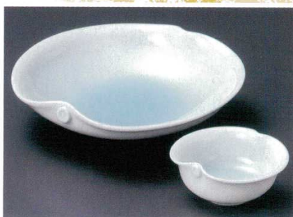
007-05-2H3 2,800円 2126010019 青磁耳付刺身鉢 (15.5×17.2×4.8H) 007-06-2H3 1,200円 2126010020 青磁耳付千代口 (7×8.3×3.7H)