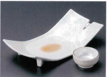
007-21-6F3 2,750円 2165010009 オレンジ吹面測上り長角皿 (26×13×5.5H) 007-22-6F3 1,250円 2165010010 ラスター丸千代口 (7φ×3.5H)