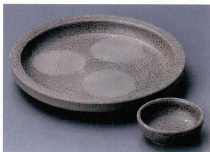
007-03-6A3 2,810円 2161010031 炭化土6.3切立丸皿 (19φ×3H) 007-04-6A3 720円 2161010032 炭化土鉄鉢丸千代口 (7φ×2.5H)