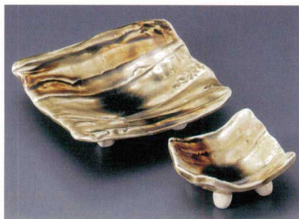
007-01-2H3 2,800円 2326007001 灰釉刺身皿 (17×16×4.5H) 007-02-2H3 1,200円 2326007002 灰釉小付 (9×9×4.5H)