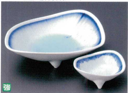
007-13-2A3 2,760円 2021005001 青白磁藍流し刺身鉢 (19×14×5.5H) 007-14-2A3 1,160円 2021005002 青白磁藍流し千代口 (9.5×7.8×3.5H)