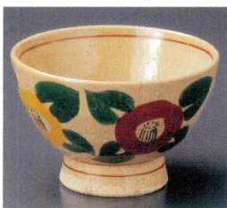
071-17-6B3 1,980円 2362071017 上絵椿高台小鉢 (10.8φ×7.2H)