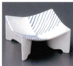
071-15-6F3 2,000円 2265077007 ストライプ高台小鉢 (11.7×11.7×6H)