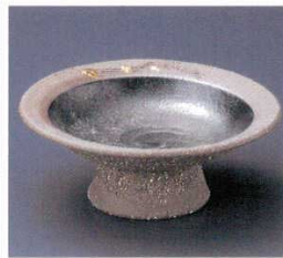
071-10-7E3 2,200円 2074070028 黒柚子金彩高台小鉢 (13φ×5.8H)