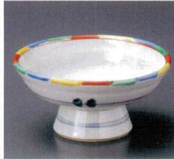
071-03-1K3 2,400円 1917062013 紙風船高台小鉢 (12.2φ×5.7H)