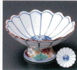
071-05-6F3 2,350円 1965062007 菊割春秋高台小鉢(大) (13φ×6H)