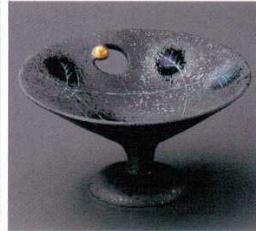
071-04-6F3 2,400円 2365071004 黒釉透かし高台小鉢 (14.5φ×8H)