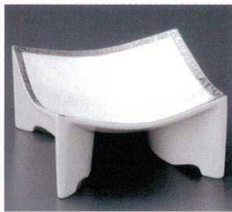
071-08-6F3 2,300円 2265077006 白プラチナ正角皿 (11.5×11.5×6H)