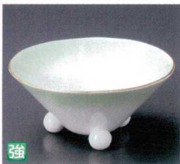
071-24-6F3 1,850円 2365071024 測金ヒワ吹三つ足小鉢 (11.7φ×5.3H)