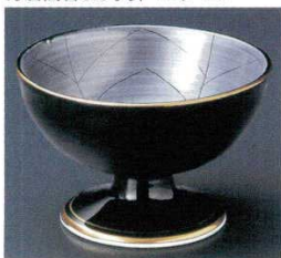
071-12-6F3 2,100円 1965062018 銀彩高台小鉢 (11.3φ×7.4H)