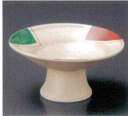
071-02-2F3 2,400円 1925062006 荒土三色交趾高台小鉢 (12.3φ×5.7H)