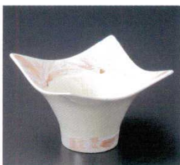
071-18-6F3 1,950円 2365071018 ピンクラスター小鉢 (11×11×8H)