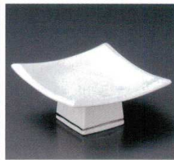
071-11-6F3 2,150円 2365071011 ラスラー刷毛目高台皿 (13.5×13.5×6.5H)