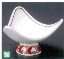
071-21-2A3 1,830円 2221075017 赤絵点ツナギ三角高台小鉢(大) (11×11×6.8H)