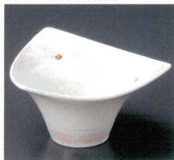
071-27-7F3 1,800円 2375071027 ピンクラスター三角小鉢 (11φ×5.5H)