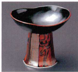
071-09-7E3 2,250円 2374071009 黒釉高浜小鉢 (11×9.3×9.5H)