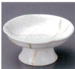
071-14-7E3 2,000円 2374071014 彩竹高台小鉢 (11.5φ×5.5H)