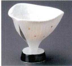
071-01-6F3 2,400円 2165083010 点紋ラスター小付 (10×9.5×9H)