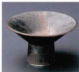
071-26-8F3 1,800円 2385071026 金結晶高台小鉢 (13φ×7.5H)