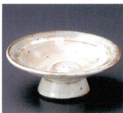
071-19-2C3 1,900円 1923063021 粉引くし目高台鉢 (14φ×5.6H)