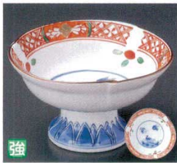
071-06-2F3 2,350円 1925269004 万暦高台4.0小鉢 (12.2φ×7.3H)