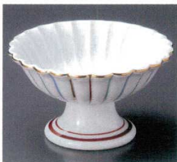
071-25-1B3 1,820円 1912063002 錦十草菊型高台小鉢 (11.4φ×6.4H)