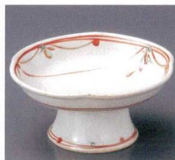
071-16-7E3 1,950円 2274070105 赤絵輪花高台小鉢 (11.8φ×5.7H)