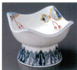
071-20-4B3 1,850円 1942062026 染錦ひさご小鉢 (10.8×10.8×8.5H)