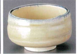
726-10-4A3 2,400円 2341726010 オフケ抹茶碗(トムソン) (12.6φ×7.5H)