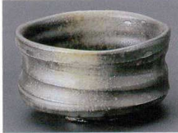
726-02-3C3 2,500円 2033644017 備前抹茶碗(貼箱) (12.5φ×7H)