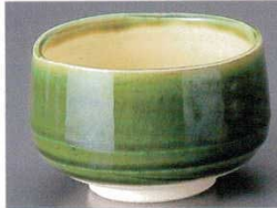
726-01-4A3 2,400円 2341726001 織部抹茶碗(トムソン) (12.6φ×7.5H)

和食器 小鉢 茶碗 和陶オーブン 耐熱 萬古焼 洋食器 碗 脚 中華食器 カラス 金属 茶道具 雑器 木竹製品 神仏具