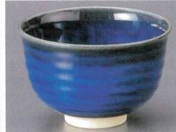
726-18-6Y3 1,700円 2368726018 抹茶茶碗 段目青(トムソン箱) (13φ×7.5H) 1入