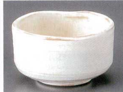
726-13-7E3 2,200円 2074649005 御本手抹茶碗(化粧箱) (11.2φ×6.8H)