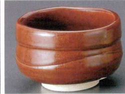
726-09-4A3 2,400円 2341726009 赤染抹茶碗(トムソン) (12.6φ×7.5H)