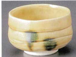
726-12-4A3 2,400円 2341726012 黄瀬戸抹茶碗(トムソン) (12.6φ×7.5H)