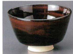
726-21-6Y3 1,700円 2368726021 抹茶茶碗 胎釉(トムソン箱) (12φ×8H) 1入