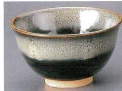
726-16-6Y3 1,700円 2368726016 抹茶茶碗 天目(トムソン箱) (12φ×8H) 1入