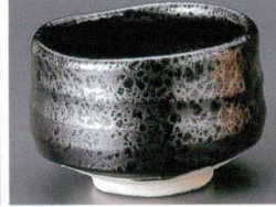
726-04-3C3 2,500円 1933601002 油滴天目抹茶碗(貼箱) (12.5φ×8.4H)