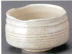
726-07-4A3 2,450円 2041645016 灰釉抹茶碗(トムソン箱) (12φ×7.2H)