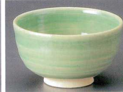
726-19-6Y3 1,700円 2368726019 抹茶茶碗 深緑(トムソン箱) (12φ×8H) 1入