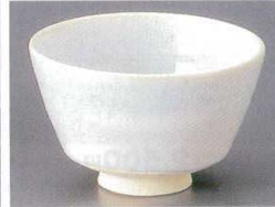
726-23-6Y3 1,700円 2368726023 抹茶茶碗 白釉(トムソン箱) (12φ×8H) 1入