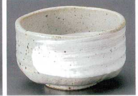
726-25-2C3 1,600円 2023645025 抹茶碗白刷毛(化) (12.5φ×7.3H)