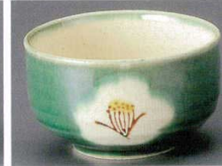
726-29-4A3 1,500円 2341726029 織部梅抹茶碗(トムソン) (12.5φ×7.3H)