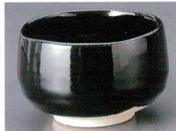
726-11-4A3 2,400円 2341726011 天目抹茶碗(トムソン) (12.6φ×7.5H)