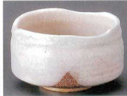
726-08-4A3 2,450円 2041645017 桜志野抹茶碗(トムソン箱) (12φ×7.2H)