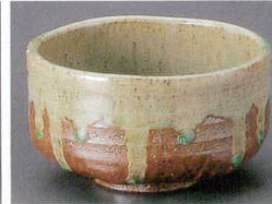
726-28-2C3 1,600円 1923601025 抹茶碗ピード口(化) (12.5φ×7.3H)