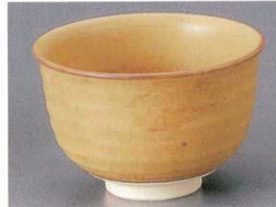
726-22-6Y3 1,700円 2368726022 抹茶茶碗 段目イロ(トムソン箱) (13φ×7.5H) 1入