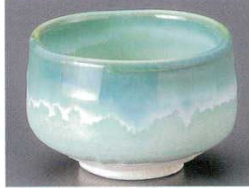
726-03-4B3 2,600円 1942601014 均霰抹茶碗(貼箱入) (12.5φ×8.4H)