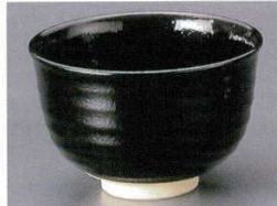
726-17-6Y3 1,700円 2368726017 抹茶茶碗 段目ゆず天目(トムソン箱) (11.8φ×7.5H) 1入