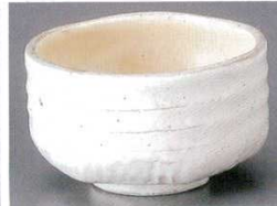
726-27-2C3 1,600円 1923601024 抹茶碗姫粉引(化) (12.5φ×7.3H)