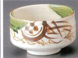
726-14-6Y3 2,000円 2068647010 織部抹茶碗(トムソン箱) (10.5φ×7.5) 1入