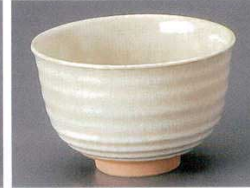
726-24-6Y3 1,700円 2368726024 抹茶茶碗 段目白(トムソン箱) (13φ×7.5H) 1入