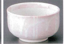
726-30-4A3 1,500円 2341726030 桜志野十草抹茶碗 (12.5φ×7.3H)