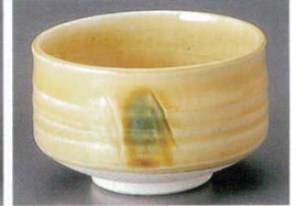
726-15-6Y3 2,000円 2068645008 黄瀬戸抹茶碗(トムソン箱) (10.5φ×7.5H) 1入