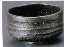
726-26-2C3 1,600円 2023645020 抹茶碗黒釉(化) (12.5φ×7.3H)