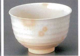
726-20-6Y3 1,700円 2368726020 段目粉引き抹茶碗(トムソン箱) (11.8φ×7.5H) 1入