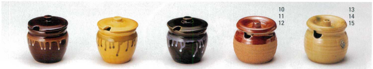
733-07-6C3 580円 2363733007 ア×白流し口切2号蓋物 (9φ×10H) 10入