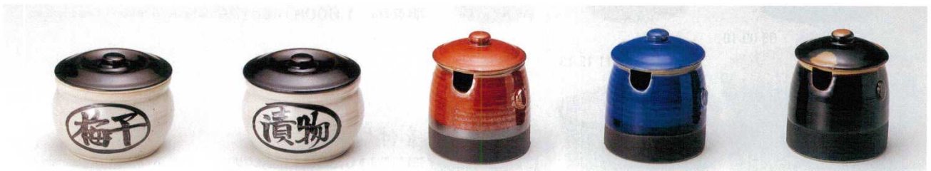
733-16-6C3 1,150円 2363733016 梅干蓋物 (10φ×8H)