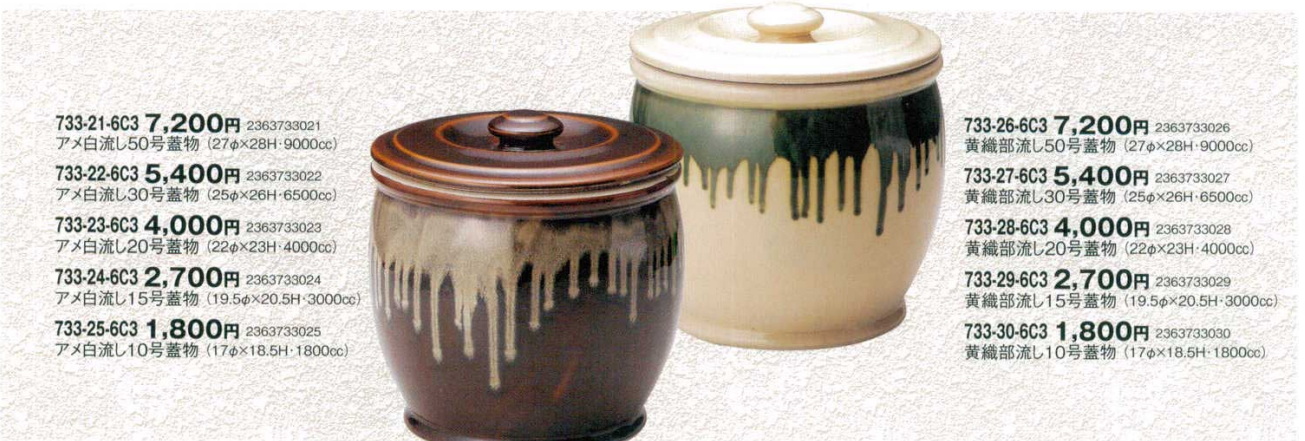
733-21-6C3 7,200円 2363733021 ア×白流し50号蓋物 (27φ×28H・9000cc)