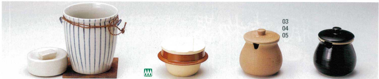
733-01-6F3 3,200円 1965613002 一夜漬セット十草 (16×14.5×16H) 中国