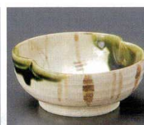
074-35-6A3 1,380円 2161005019 手造り織部まゆ形小々井 (7×6×2.5H)