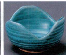
074-32-6F3 1,500円 1965066003 トルコ三ツ山小付 (8.2φ×4.8H)