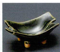
074-36-2H3 1,300円 2126499052 織部重ね四足小付 (11.8×7×4.8H)