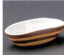
074-23-7E3 1,700円 2374074023 ホーダー楕円小鉢 (13.6×6.5×3.8H)