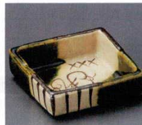
074-31-2A3 1,500円 2321074031 織部つる花角千代口 (7×7×2.2H)