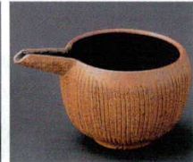
074-14-7E3 2,200円 2374074014 焼ノ鉄砂片口小付 (10.5×7.5×5.8H)