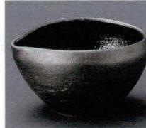
074-25-1K3 1,600円 2017074018 南蛮片口珍珠 (9.5×8.3×5H)