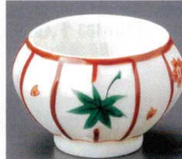
074-19-6E3 1,800円 2264078019 錦ボンボリ珍珠(大) (8φ×6.3H)