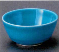
074-21-7C3 1,700円 2173086011 青交趾丸千代口 (8φ×3.8H)