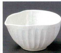
074-29-1K3 1,500円 2217078032 黄地3.2瓢型小付 (9.5×9×5H)