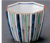
074-18-7C3 1,800円 1973064021 色十草八角小々鉢 (7.3φ×6.3H)