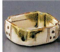
074-17-6A3 1,870円 1961006002 手造り織部2.5長角井 (7.5×6.5×2.5H)