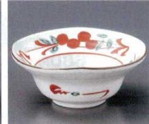
074-26-6E3 1,580円 2364074026 玉花つば型小鉢 (11.5×11.5×4.5H)