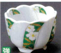
074-27-7F3 1,500円 2275078026 彩花小付 (7.5φ×5.6H)