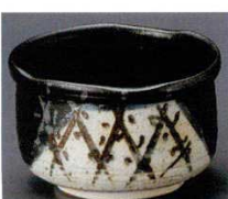
074-33-6B3 1,450円 2162086013 黒オリベ掛格子小鉢(小) (8.5φ×6.5H)