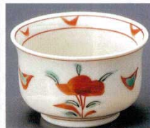
074-30-7C3 1,500円 1973065020 高麗赤絵小付 (7φ×4.5H)