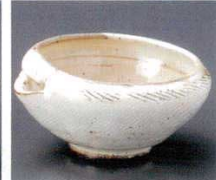
074-20-7E3 1,600円 2274078018 粉引欄目片口小付 (10×9.5×5H)