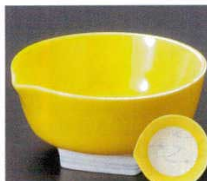
074-28-6F3 1,550円 1965064024 黄釉流水片口小付 (9.3×8.8×4.7H)