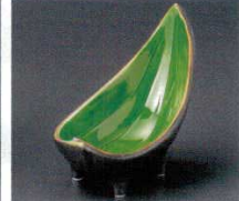
074-11-7F3 2,250円 2075038003 鉄砂交趾蓍舟中付 (12.7×6.8×10H)