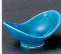
074-10-7F3 2,470円 2375074010 トルコ双葉小鉢 (12×8.2×5.4H)