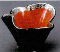
074-15-6F3 2,100円 2365074015 赤プラチナ花型小付 (10×10×6.6H)