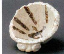
074-09-6F3 4,100円 1965064006 白釉ちぎり小付 (10×10×7.5H)

074-01-1B3 880円 2212078001 いぶし黒石目ピンク吹丸小鉢(小) (8.4φ×3H) 074-02-1B3 880円 2212078002 いぶし黒石目ルリ吹丸小鉢(小) (8.4φ×3H) 074-03-1B3 880円 2212078003 いぶし黒石目白吹丸小鉢(小) (8.4φ×3H) 074-04-1B3 2,500円 2212078004 白磁石目11.0プレート (31.2×10.6×1.7H) 074-05-1B3 780円 2212078005 白磁石目ピンク吹角小鉢(小) (8.2φ×3.5H) 074-06-1B3 780円 2212078006 白磁石目コス吹角小鉢(小) (8.2φ×3.5H) 074-07-1B3 780円 2212078007 白磁石目角小鉢(小) (8.2φ×3.5H) 074-08-1B3 2,500円 2212078008 焼繪石目11.0プレート (31.2×10.6×1.7H)