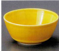
074-22-7C3 1,700円 2173086010 黄交趾丸千代口 (8φ×3.8H)