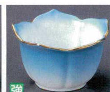
074-38-2A3 1,270円 2321074038 測金ブルー吹栞型小付 (7.8×7.8×4.7H)