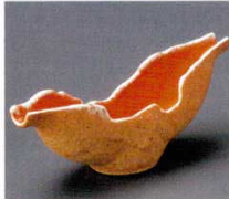
074-16-6F3 2,100円 2265078017 変り舟型辰砂小鉢 (17×5.5×6H)