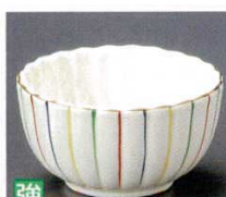
074-34-2A3 1,330円 2321074034 赤絵十草菊型2.8小付 (8φ×4.5H)