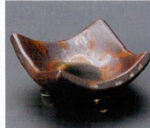
074-24-4B3 1,600円 1942073012 鉄砂灰釉流し珍珠 (9×9×4H)