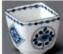
074-12-1K3 2,200円 2217078014 古染亀甲3.3角小付 (7.8×7.8×7.1H)