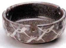
742-07-4E3 930円 2044664016 土物鉄赤アミ4.0灰皿 (12φ×4.8H)