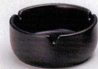
742-11-2B3 550円 1922621018 黒鉄鉢三ツ切灰皿 (10φ×4.3H)