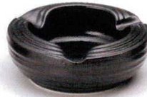
742-03-2B3 650円 1922620019 ゆず天目鉄鉢灰皿 (11φ×4H)