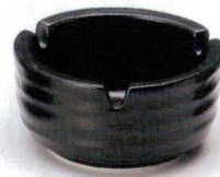
742-04-2B3 650円 1922620016 ゆず天目六兵三ツ切灰皿 (10×5.3H)