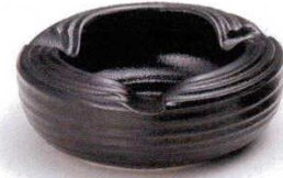
742-01-2B3 950円 1922619014 黒ゆずドーム型灰皿 (13φ×5H)