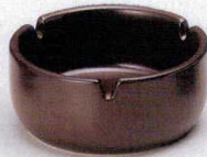
742-12-2B3 550円 1922621017 茶マット鉄鉢三ツ切灰皿 (10φ×4.3H)