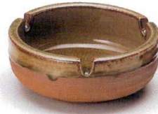
742-09-4E3 930円 2044664014 土物信楽4.0灰皿 (12φ×4.8H)