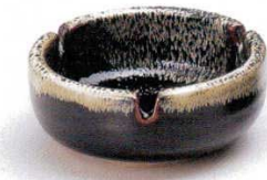
742-06-4E3 930円 2044664015 土物天目流し4.0灰皿 (12φ×4.8H)