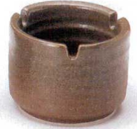
742-05-2B3 650円 1922619024 伊賀切立深灰皿 (9φ×6.8H)