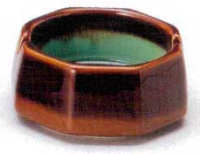
742-10-2B3 550円 2222736013 アメガラス袖八角灰皿 (8.5×8.5×4.5H)