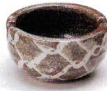
742-08-4E3 680円 2244736003 土物鉄赤ミニ灰皿 (8φ×4.3H)