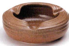
742-02-2B3 950円 1922619013 伊賀ドーム型灰皿 (13φ×5H)