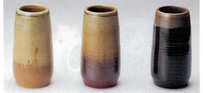
746-04-6C3 2,050円 2363746004 伊賀布目花瓶 (11φ×22H) 1入