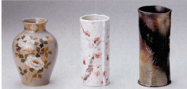
746-01-1E3 6,800円 2314746001 グレー白牡丹8号花瓶 (16.5φ×24H) 1入