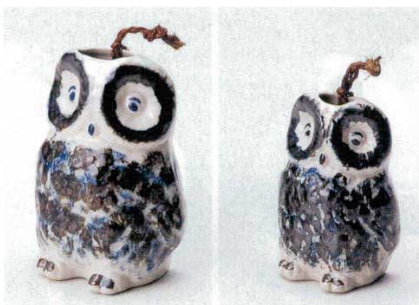
746-26-6C3 900円 2363746026 ふくろう壁掛け花入(大) (8.5×5.5×12.5H) 1入