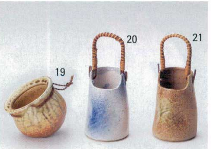
746-19-6B3 1,600円 2262740008 タコボット一輪差 (10φ×9.5H) 1入 746-20-6C3 1,000円 2363746020 吹墨ツル付一輪差 (7.2φ×16H) 10入 746-21-6C3 1,000円 2363746021 伊賀ツル付一輪差 (7.2φ×16H) 10入