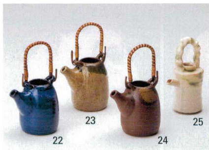
746-22-3B3 850円 2132742003 土瓶型ナマコ一輪立 (9φ×9.5H) 10入 746-23-3B3 850円 2132742002 土瓶型オリベ一輪立 (9φ×9.5H) 10入 746-24-3B3 850円 2132742001 土瓶型俵しめ一輪立 (9φ×9.5H) 10入 746-25-6B3 1,080円 2262740015 灰志野土瓶型一輪差 (8×5.4×14.4H) 1入