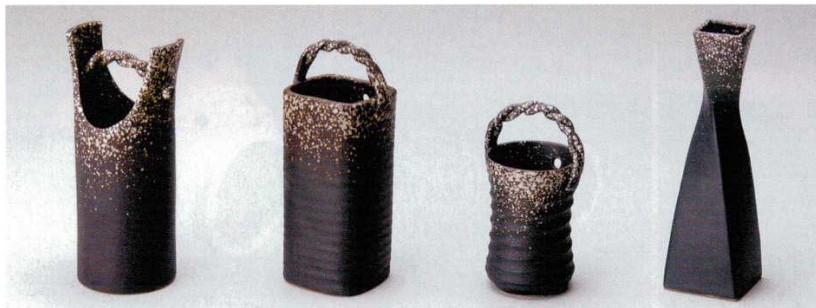
746-07-6C3 3,000円 2363746007 錆白吹手桶花瓶 (9.5×8×20H) 1入