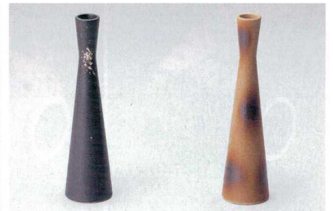
746-11-6C3 1,200円 2363746011 錆白吹一輪差し (5.3φ×20.5H) 1入