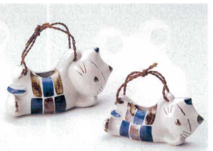
746-28-6C3 900円 2363746028 ネコ壁掛け花入(大) (16.5×4.5×8.5H) 1入