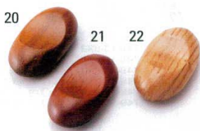
木製箸置(クリア塗装付)