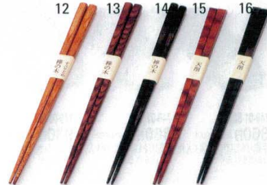
食器洗浄機対応箸