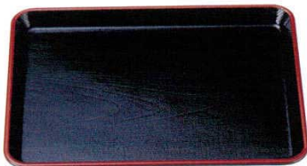
FRP 耐熱ケヤキ長手盆 黒天朱[ノンスリップ加工]