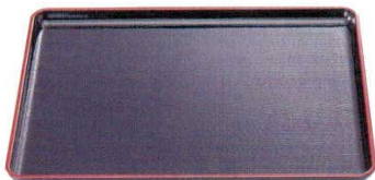
A 一休木目盆 黒天朱[ノンスリップ加工]