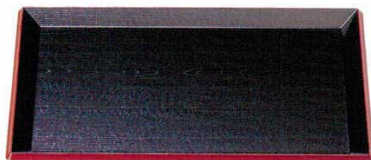
A 富士長手木目盆 黒淵朱