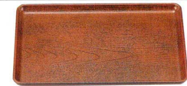
A ケヤキ会席盆 栃