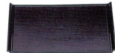
A 宴目盆 黒[ノンスリップ加工]