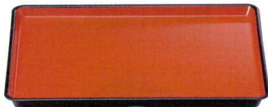
TA 耐熱長手刷毛目盆 朱天黒[ノンスリップ加工]