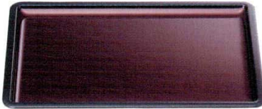
A 越前盆 溜パール[ノンスリップ加工]