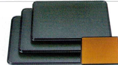
A 長手両面盆 グリーン石目/金梨地[A面ノンスリップ加工]