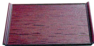
TA 耐熱宴へぎ目盆 溜[ノンスリップ加工]