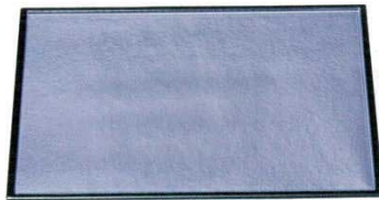
A 日野盆 紫雲流淵黒[ハード塗]