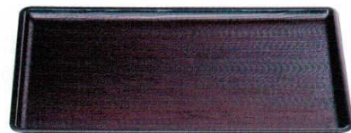
A 焼杉長手盆 溜