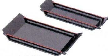
762-15-2S3 1,250円 2329762015 A (小) 笹舟盛皿 黒天朱 本体 (27.2×9.2×3.5H) 100入 762-16-2S3 1,800円 2329762016 A (大) 笹舟盛皿 黒天朱 本体 (27.2×14.5×3.3H) 60入