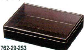
762-29-2S3 2,150円 2329762029 A (小) 長角盛箱 溜 (20×14.8×5H) 60入