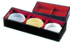
A (小) 三点珍味入れ 黒内朱 762-07-2S3 1,000円 1929639001 本体のみ (19.3×9.6×3.7) 762-08-2S3 630円 1929639002 陶梅豆皿 (1ヶ) (5.8φ×1.8H) 762-09-2S3 850円 2029687003 A (小) 二点珍味入れ 黒内朱 (13×6.8×3.6H)