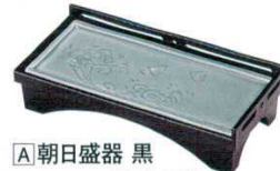
A 朝日盛器 黒 762-27-2S3 2,300円 1929639012 本体 (26×12.5×5.5H) 762-28-2S3 2,450円 1929639013 陶板 グリーン波千鳥