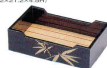
762-31-2S3 2,300円 2229758021 A お料理箱 黒笹 (20.1×12×6.4H) 762-32-2S3 1,900円 2229758022 木製スノ子 (18.3×10.4×1H)