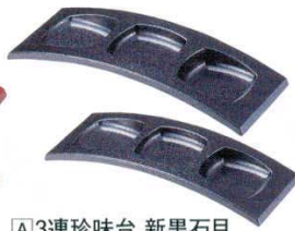
A 3連珍味台 新黒石目 762-05-2S3 1,750円 2229758012 (大) (27.3×10.3×4H) 762-06-2S3 1,550円 2229758013 (小) (24.5×9.3×3.5H)