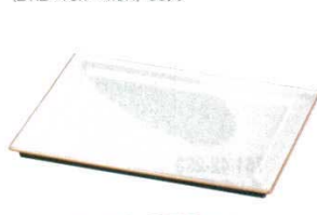
762-37-2S3 1,850円 2329762037 A 8.5寸長手懐石プレート 白アクリル測金 ハード塗 (25.8×18.6×1.5H) 80入