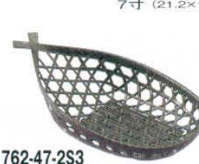
762-47-2S3 850円 2229758045 A 舟型かご グリーン (26×15×6.6H)