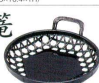
A 新片手かご 茶パール 762-38-2S3 550円 1929639014 5寸 (16.8×15φ×4H) 762-39-2S3 650円 1929639015 6寸 (19.5×18φ×4.4H)