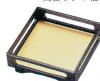
A 5.5寸日野盛器 黒 762-33-2S3 2,000円 1929639009 本体 (16.8×16.8×6.5) 762-34-2S3 1,050円 1929639010 中皿 金/朱