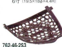
762-46-2S3 850円 2229758043 A 三角平皿 茶パール (20.5×19.7×5.4H)