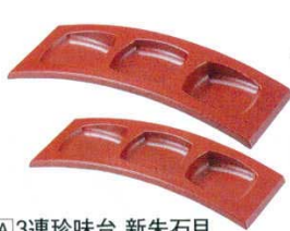
A 3連珍味台 新朱石目 762-03-2S3 1,800円 2229758010 (大) (27.3×10.3×4H) 762-04-2S3 1,550円 2229758011 (小) (24.5×9.3×3.5H)