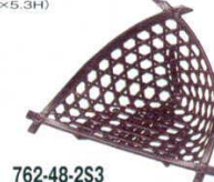
762-48-2S3 1,050円 2229758047 A 三角かご 茶パール (24.2×14.7×13.7H)

和食器・小鉢・茶碗 漆器・新調・和風・洋風 酒器・箸置き 抹茶器 茶箱・茶筒 和陶・オーブン 耐熱・菓古餅 洋食器・焼皿 中華食器 カラダ金属 茶道具 雑器 木竹製品 神仏具