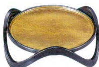
A 凡情盛器 金雲流天黒 762-21-2S3 2,100円 2229758036 5.5寸 (17.5φ×7.1H) 762-22-2S3 3,200円 2229758037 7寸 (22φ×8.5H)