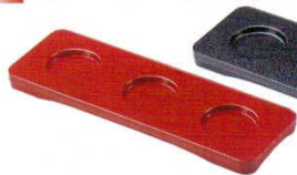
762-01-2S3 950円 2229758001 A 三点珍味台 本朱塗 (26.1×9.1×1.6H)