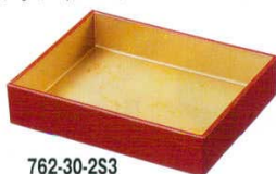
762-30-2S3 3,000円 2329762030 A (大) 長角盛箱 朱内色紙金箔 S・H塗 (21.2×16.7×4.6H) 50入