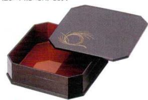
762-35-2S3 1,100円 2329762035 A 緑高弁当 茶パール柳結び内朱 蓋のみ (17.1×17.1×1H) 762-36-2S3 1,150円 2329762036 A 緑高弁当 茶パール柳結び内朱 親のみ (17.1×17.1×5.8H)