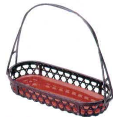
762-17-2S3 1,600円 2329762017 A 8.5寸長手愛染籠 溜 (折畳式) (25×10.9×22H) 60入 762-18-2S3 600円 2329762018 M 愛染籠用皿 朱 (23.2×9.3×0.8H) 200入