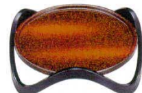
A 凡情盛器 新雲 762-19-2S3 1,950円 2229758034 5.5寸 (17.5φ×7.1H) 762-20-2S3 3,100円 2229758035 7寸 (22φ×8.5H)