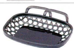
A 四方片手かご 茶パール 762-40-2S3 550円 1929639016 4.5寸 (13.8×10.3φ×3.8H) 762-41-2S3 700円 1929639017 5.8寸 (17.5×13.2φ×4.5H) 762-42-2S3 800円 1929639018 7寸 (21.2×16φ×5.3H)