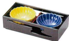
A 6寸長角透かし盛器 黒 762-10-2S3 1,750円 1929639003 本体 (18.1×9.1×4.8) 762-11-2S3 750円 1929639004 2ヶ仕切 762-12-2S3 500円 1929639005 ABS 2.6寸菊型 干代久 (1ヶ) (8φ×3.2H)