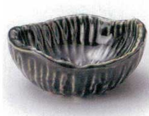
079-34-1B3 430円 2112091017 織部トチリ小付 (7.6×7.2×3.2H)