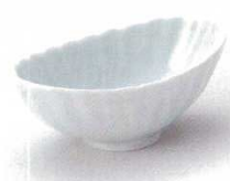
079-33-8F3 440円 2285085011 青磁菊舟型小付 (11×6.5×4H)