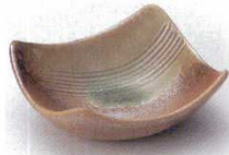
079-01-2B3 510円 2122090028 オリベくし目小付 (8.8×8.8×3.2H)