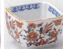
079-25-2K3 460円 1927069020 花鳥小付 (7.2×7.2×5H)