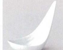
079-30-6E3 430円 2364079030 笹珍味白 (9×4.5×7.4H) 100入