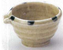
079-15-5E3 480円 2154090035 灰軸黒点 測厚片口小付 (10×9×5.7H)