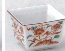
079-26-2K3 460円 1927070011 赤絵小付 (6.7×6.7×4.8H)