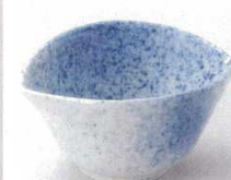
079-31-7F3 450円 2175091004 吹スミかさ小付 (11.7×9.7×5.4H)