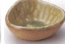
079-05-6E3 500円 2364079005 ビードロ流し3.0小附 (9.7×9.2×3.5H) 120入