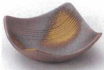
079-02-1B3 530円 2112090030 焼締くし目小付 (9×8.8×3.4H)