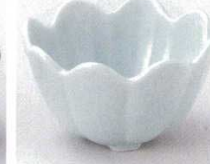
079-38-8F3 430円 2285085007 青磁八手小付 (9.5φ×5.5H)

刺身向小鉢珍味 和風和風大面盛鉢 湯呑茶碗 井茶碗 急須茶碗 和陶オーブン 耐熱 萬古焼 洋食器 碗皿 中華食器 カラス 金属 茶道具 雑器 木竹製品 神仏具