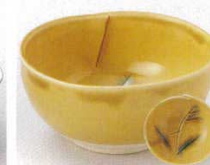
079-20-2B3 460円 1922070029 黄瀬戸スキ小付 (9×8×4H)