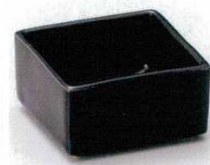
079-18-1B3 480円 2112091014 黒釉角千代口 (6.5×6.5×3.4H)