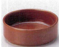
079-07-6A3 500円 1961070003 柿天目3.0切立丸井 (8.5φ×3H) 079-08-6A3 480円 2161091035 柿天目2.5切立形丸井 (7.5φ×3H) 079-09-6A3 470円 2161091036 柿天目2.0切立形丸井 (6.5φ×2.5H)