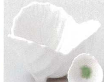
079-29-6A3 450円 1961069025 白マツ3.0三ツ葉井 (8.5φ×5.5H)