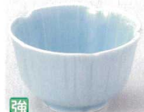
079-23-1B3 480円 2012079012 青白梅型小付(小) (7.8φ×4.7H)