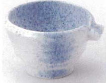
079-16-7F3 450円 2175091005 吹スミ測厚片口小付 (10×9×5.8H)