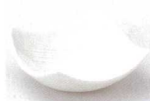
079-03-5E3 490円 2154245004 黄磁くし目小付 (8.9×8.9×3.3H)