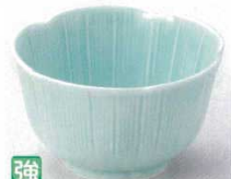
079-22-1B3 480円 2012079010 ヒスイ梅型小付(小) (7.8φ×4.7H)