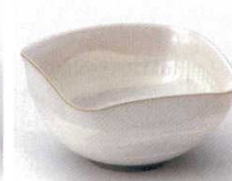
079-19-6B3 480円 1962069015 京唐津結角小付 (9×9×5H)