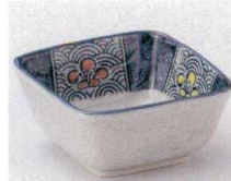
079-11-6H3 500円 2266084005 梅祥瑞角小付 (8.1φ×4H)