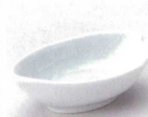
079-12-6E3 480円 2264084004 青白磁花びら千代口 (10.5×7×2.7H)