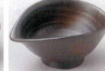
079-06-7E3 500円 2174076004 黒伊賀ねじ鉢(小) (10.8×8.1×5.1H)