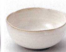
079-13-6B3 480円 1962070012 京唐津珍味 (8.5φ×4H)