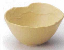
079-36-5E3 430円 2254084026 黄土釉丸千代口 (9.8φ×4.5H)