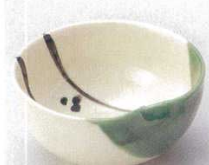
079-27-2B3 460円 1922070025 オリベ半掛片押小付 (9φ×4.3H)