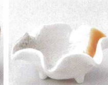
079-14-6C3 480円 1963075020 二色吹波形三ツ足小付 (10.5×8×4H)