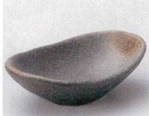
079-28-3B3 450円 2132091024 古窯舟型小付 (12×8×3.6H)