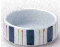
079-10-6E3 500円 2264083011 十草スタック(小)小附 (7.8φ×3H)