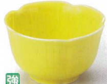
079-21-1B3 480円 2012079011 黄梅型小付(小) (7.8φ×4.7H)