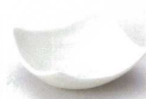
079-04-5E3 490円 2154245003 もえぎくし目小付 (8.9×8.9×3.3H)