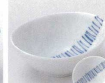
079-32-5E3 450円 2154091021 さんばし 楕円小付 (10×8.5×4H)