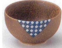
079-35-1B3 430円 1912071016 信楽市松小付 (7.2×4.1H)