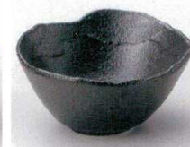
079-37-5E3 430円 2254084027 黒壁丸千代口 (9.5φ×4.5H)