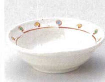
079-24-2B3 460円 2022067017 きらら3.0小付 (10φ×3.2H)