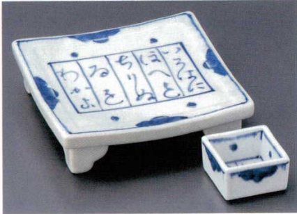
008-07-2F3 2,600円 1925011035 古染いろは四ツ足正角5.5向付 (16×16×4H) 008-08-2F3 950円 1925011036 古染いろは正角千代口 (5.4×5.4×3.2H)