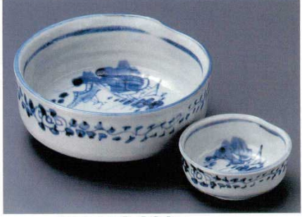
008-05-1B3 2,630円 1912012020 古染山水刺身鉢 (14.6φ×5.8H) 008-06-1B3 1,080円 1912012021 古染山水千代口 (8φ×3.4H)