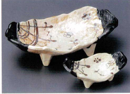
008-09-4B3 2,600円 2342008009 黒織部刺身(足付) (20.6×13×4.8H) 008-10-4B3 1,400円 2342008010 黒織部千代口(足付) (11.5×7.3×3.8H)