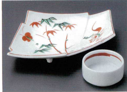
008-19-1B3 2,580円 1912011031 赤絵結び刺身 (20.8×14.4×3.6H) 008-20-1B3 580円 1912011032 赤絵丸千代口 (6.6φ×3H)