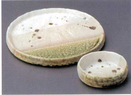
008-13-7E3 2,600円 2274202010 粉引織部5.5平皿 (17φ×1.5H) 008-14-7E3 1,060円 2374008014 粉引織部千代口 (8φ×2.5H)