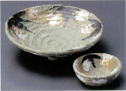
008-01-6A3 2,670円 2161028015 よもぎ釉金たき平刺身皿 (17φ×4.5H) 008-02-6A3 1,560円 2161012012 よもぎ釉金たき丸千代口 (8φ×3.5H)

刺身 和風 酒器 急須 和陶 刺身 洋食 中華 ガラス 茶道具 雑器 木竹 神仏