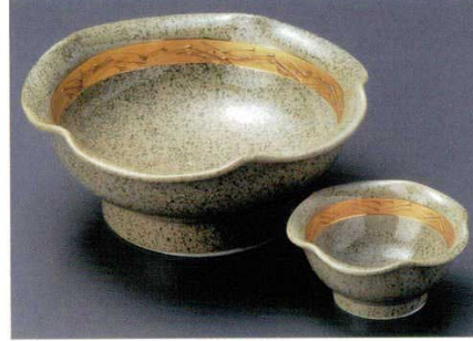
008-21-2A3 2,550円 1921012012 金彩若草花型刺身鉢 (15.7φ×6.8H) 008-22-2A3 780円 1921012013 金彩若草花型千代口 (8φ×3.8H)