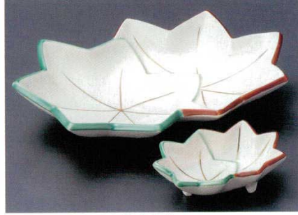
008-15-1B3 2,600円 1912011039 錦紅葉型刺身鉢 (18.4×14.2×3.6H) 008-16-1B3 1,050円 1912011040 錦紅葉型千代久 (9×6.6×2.8H)