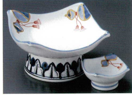
008-23-4B3 2,550円 1942012018 染錦ひさご刺身鉢 (15×15×8.5H) 008-24-4B3 850円 1942012019 染錦ひさご千代口 (7.5×7.5×3.7H)