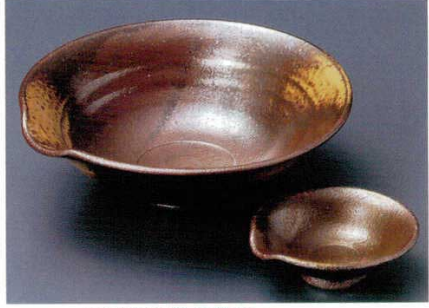
008-11-7E3 2,600円 1974012024 華備前片口向付 (16.5φ×5.5H) 008-12-7E3 680円 1974012025 華備前千代口 (7.6φ×2.8H)