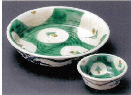
009-03-2F3 2,750円 1925011033 グリーン交趾花絵向付 (15.3φ×3.5H) 009-04-2F3 1,400円 1925011034 グリーン交趾花絵千代口 (7φ×3H)