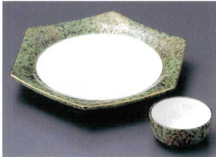
009-07-6F3 2,480円 1965013019 グリーン金彩皿 (20φ×2.6H) 009-08-6F3 1,050円 1965013020 グリーン金彩千代口 (6.7φ×3H)