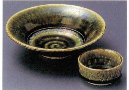
009-05-6F3 2,400円 1965014015 織部丸向付 (16.5φ×4H) 009-06-6F3 1,000円 1965014016 織部丸千代口 (7φ×3.5H)