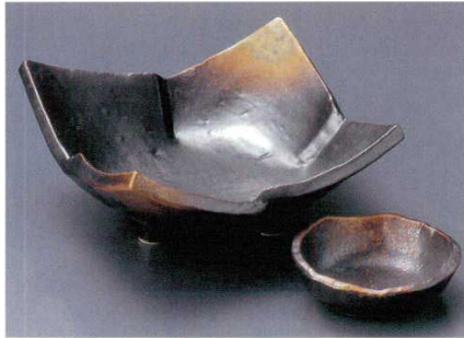
009-01-6B3 2,450円 2362009001 焼締タタラ3ッ足刺身鉢 (15.3×15.3×6.8H) 009-02-6B3 620円 2362009002 焼締タタラ丸千代口 (8.2φ×2.8H)