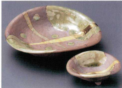
009-15-2F3 2,450円 1925013033 南蛮銀河刺身鉢 (16.5×14.5×4.8H) 009-16-2F3 1,120円 1925013034 南蛮銀河千代口 (9.2×7.8×3.4H)