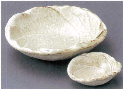
009-19-6F3 2,450円 1965012006 緑釉かいらぎ向付 (18.6×17×4.7H) 009-20-6F3 750円 1965012007 緑釉かいらぎ千代口 (9.7×8.5×3H)