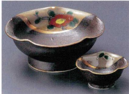
009-09-2A3 2,450円 1921013003 華南蛮花型刺身鉢 (15.7φ×6.7H) 009-10-2A3 700円 1921013004 華南蛮花型千代口 (8.2φ×4H)