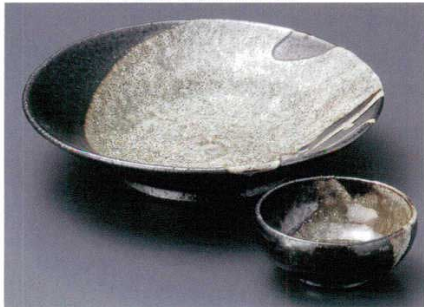
009-13-6F3 2,450円 1965013001 かいらぎ5.5浅鉢 (17φ×4H) 009-14-6F3 750円 1965013002 かいらぎ丸千代口 (7.3φ×3.3H)