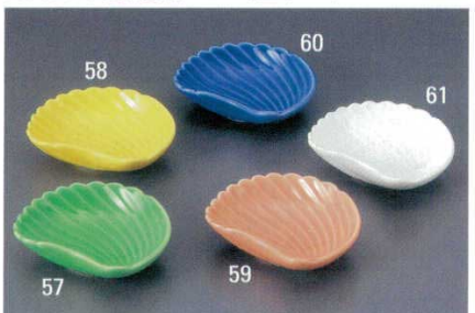
099-57-6B3 240円 ヒョウシェル皿(小) (8.8×7.3×2.2H) 2362099057 099-58-6B3 240円 黄シェル皿(小) (8.8×7.3×2.2H) 2362099058 099-59-6B3 240円 赤シェル皿(小) (8.8×7.3×2.2H) 2362099059 099-60-6B3 240円 ルリシェル皿(小) (8.8×7.3×2.2H) 2362099060 099-61-6B3 240円 白シェル皿(小) (8.8×7.3×2.2H) 2362099061

刺身向付小鉢珍味 縁起物・大皿密着 酒器・湯呑み 井茶碗 急須・茶籠 和陶・オーブン 耐熱・漂白剤 洋食器・碗皿 中華食器 ガラス・金属 茶道具 雑器 木竹製品 神仏具