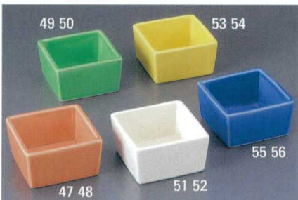
099-47-1B3 430円 赤マス型小鉢 (7×3.8H) 1912080052 099-48-1B3 360円 赤升型珍味 (5.6×3.8H) 1912081042 099-49-1B3 430円 ヒョウ升型小鉢 (7×3.8H) 1912080053 099-50-1B3 360円 ヒョウ升型珍味 (5.6×3.8H) 1912081045 099-51-1B3 430円 白軸マス型小鉢 (7×3.8H) 1912080055 099-52-1B3 360円 白軸升型珍味 (5.6×3.8H) 1912081044 099-53-1B3 430円 黄軸マス型小鉢 (7×3.8H) 1912080056 099-54-1B3 360円 黄升型珍味 (5.6×3.8H) 1912081043 099-55-1B3 430円 ルリマス型小鉢 (7×3.8H) 1912080054 099-56-1B3 360円 ルリ升型珍味 (5.6×3.8H) 1912081046