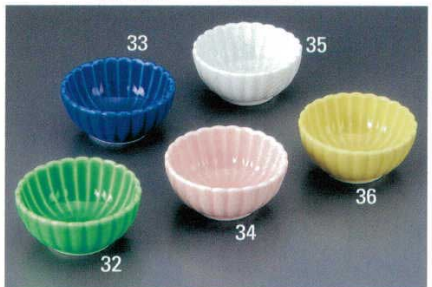
099-32-3A3 370円 ヒョウ菊型中 (8.2φ×3.6H) 1931080057 099-33-3A3 370円 ブルー菊型中 (8.2φ×3.6H) 1931080059 099-34-3A3 370円 ピンク菊型中 (8.2φ×3.6H) 1931080060 099-35-3A3 370円 白菊型中 (8.2φ×3.6H) 1931080061 099-36-3A3 370円 イエロー菊型中 (8.2φ×3.6H) 1931080058