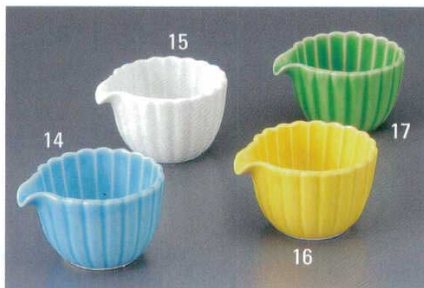
099-14-1B3 410円 トルコ菊型片口小付 (7.4×6.4×4.4H) 2212101035 099-15-1B3 410円 青白菊型片口小付 (7.4×6.4×4.4H) 2212101037 099-16-1B3 410円 黄菊型片口小付 (7.4×6.4×4.4H) 2212101036 099-17-1B3 410円 ヒョウ菊型片口小付 (7.4×6.4×4.4H) 2212101038