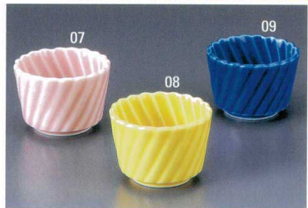
099-07-6B3 320円 ピンクねじり菊型珍味 (5.9φ×4.2H) 2362099007 099-08-6B3 320円 黄ねじり菊型珍味 (5.9φ×4.2H) 2362099008 099-09-6B3 320円 ルリねじり菊型珍味 (5.9φ×4.2H) 2362099009