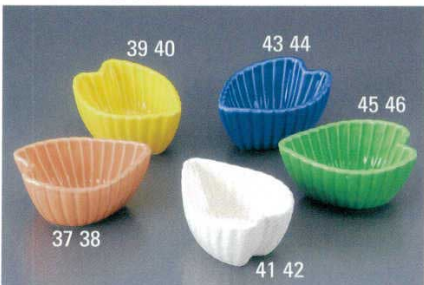
099-37-1B3 390円 赤花びら小付 (8.2×6.3×4H) 1912081029 099-38-1B3 250円 赤花びら珍味 (5.8×4.4×3H) 1912083060 099-39-1B3 390円 黄花びら小付 (8.2×6.3×4H) 1912081026 099-40-1B3 250円 黄花びら珍味 (5.8×4.4×3H) 1912083059 099-41-1B3 390円 白花びら小付 (8.2×6.3×4H) 1912081027 099-42-1B3 250円 白花びら珍味 (5.8×4.4×3H) 1912083062 099-43-1B3 390円 ルリ花びら小付 (8.2×6.3×4H) 1912081030 099-44-1B3 250円 ルリ花びら珍味 (5.8×4.4×3H) 1912083063 099-45-1B3 390円 ヒョウ花びら小付 (8.2×6.3×4H) 1912081028 099-46-1B3 250円 ヒョウ花びら珍味 (5.8×4.4×3H) 1912083061