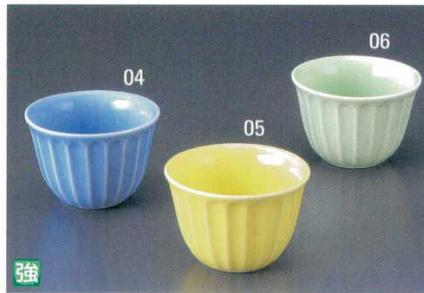
099-04-2A3 520円 ブルー輪花珍味 (6.7φ×4.5H) 2321099004 099-05-2A3 520円 黄輪花珍味 (6.7φ×4.5H) 2321099005 099-06-2A3 520円 ヒョウ吹輪花珍味 (6.7φ×4.5H) 2321099006