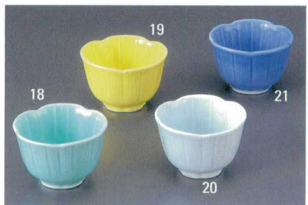
099-18-1B3 320円 ヒスイ千筋梅型珍味 (5.2×3.6H) 1912082025 099-19-1B3 320円 黄千筋梅型珍味 (5.2×3.6H) 1912082022 099-20-1B3 320円 青白磁千筋梅型珍味 (5.2×3.6H) 1912082023 099-21-1B3 320円 ムラサキ千筋梅型珍味 (5.2×3.6H) 1912062026