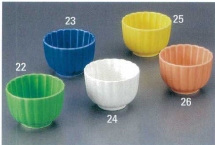
099-22-1B3 260円 ヒョウ菊型珍味 (6.2φ×4.4H) 1912082040 099-23-1B3 260円 ルリ菊型珍味 (6.2φ×4.4H) 1912082038 099-24-1B3 260円 白軸菊型珍味 (6.2φ×4H) 1912082039 099-25-1B3 260円 黄菊型珍味 (6.2φ×4.4H) 1912082036 099-26-1B3 260円 赤菊型珍味 (6.2φ×4H) 1912082037