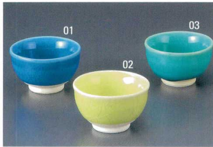
099-01-6F3 560円 青釉珍味 (5.6φ×3.4H) 1965080014 099-02-6F3 560円 黄釉珍味 (5.6φ×3.4H) 1965080013 099-03-6F3 560円 緑釉珍味 (5.6φ×3.4H) 1965080015