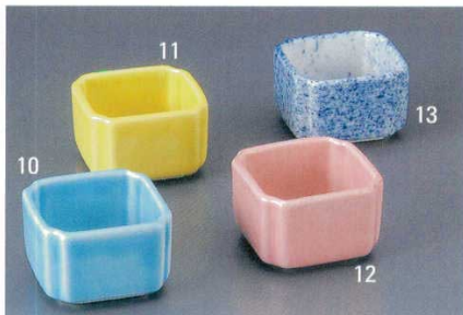
099-10-1B3 350円 トルコフチ取升型珍味 (5×3.2H) 1912081022 099-11-1B3 350円 黄フチ取升型珍味 (5×3.2H) 1912081024 099-12-1B3 350円 ピンクフチ取升型珍味 (5×3.2H) 1912081025 099-13-1B3 430円 吹墨フチ取升型珍味 (5×3.2H) 1912081023