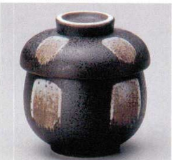
103-26-24B 600円 天目刷毛目懸型むし碗 60入 7.5×9cm