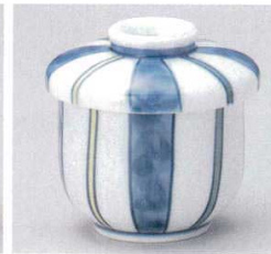
103-4-73B 920円 四方十草むし碗 80入 8.2×9.4cm