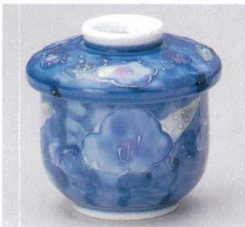
103-16-73B 920円 一珍つる花むし碗 80入 8.2×9.4cm