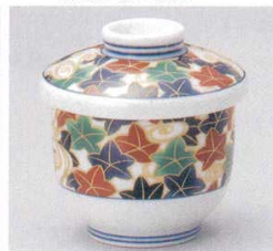
103-24-52B 750円 紅葉むし碗 80入 8×9.8cm