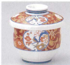
103-23-52B 750円 菊唐草むし碗 80入 8×9.8cm