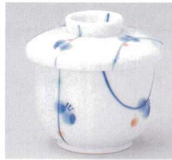
103-8-73B 920円 枝梅むし碗 80入 8.2×9.4cm