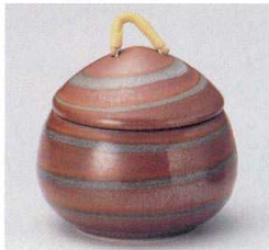
103-12-32B 720円 赤辰砂鳴門むし 60入 7.3×銅9.3×8.5cm 250cc