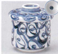
103-18-70B 880円 水泡切立むし碗 10×8入 7×8cm