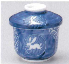
103-22-70B 760円 京祥瑞むし碗(小) 10×8入 7.2×8.5cm