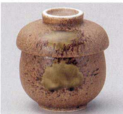
103-27-24B 600円 伊賀織部懸型むし碗 60入 7.5×9cm