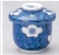
103-9-73B 920円 梅ダミむし碗 80入 8.2×9.4cm