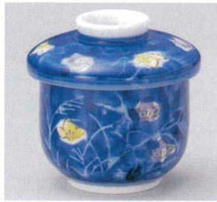
103-7-73B 920円 二色桔梗むし碗 80入 8.2×9.4cm