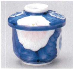
103-1-73B 920円 菊ダミむし碗 80入 8.2×9.4cm