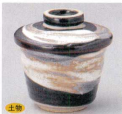
103-28-23B 670円 雲むし碗 60入 φ8.0×8.8cm