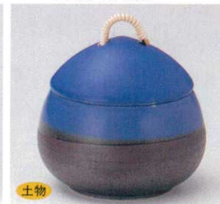
103-15-32B 720円 均窯むし碗 60入 7.3×銅9.3×8.6cm