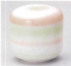
103-11-1B 900円 夏目三色むし碗 15×4入 7.7×7.7cm