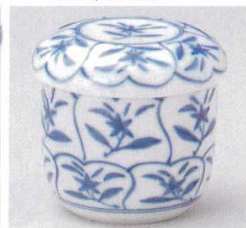
103-31-11B 570円 なすな夏目むし碗 80入 7.9×8cm