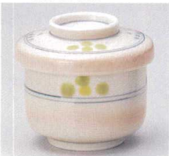
103-21-74B 760円 萩風早春むし碗 60入 8×8.2cm