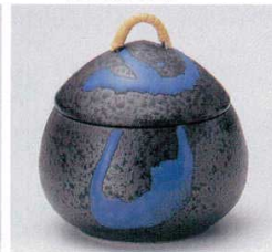
103-14-32B 720円 清流むし碗 60入 7.3×銅9.3×8.6cm