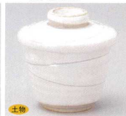
103-25-23B 670円 粉引むし碗 60入 φ8.0×8.8cm