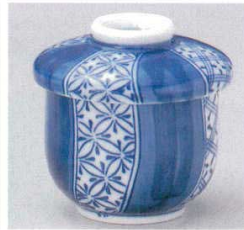
103-3-73B 920円 祥瑞むし碗 80入 8.2×9.4cm