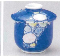
103-5-73B 920円 夢水玉むし碗 80入 8.2×9.4cm