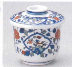
103-19-70B 850円 間取花鳥むし碗 10×8入 8.2×9.2cm