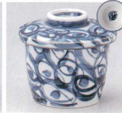
103-10-70B 900円 水泡むし碗(大) 10×8入 7.8×8.3cm