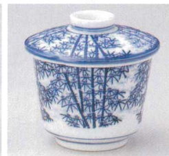
103-20-73B 800円 竹林むし碗 80入 8.5×9.4cm