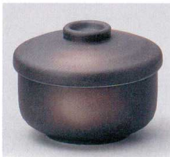
103-17-20B 850円 備前風大むし碗 60入 10.4×8cm