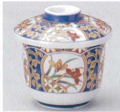
103-2-70B 950円 金彩鎮草花むし碗 10×8入 8.2×9.2cm