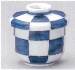
103-6-73B 920円 市松むし碗 80入 8.2×9.4cm