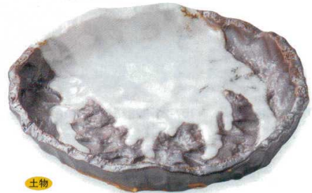
108-8-45B 6,300円 残雪盛皿(手造り)(小) 20入 26×22×4.5cm