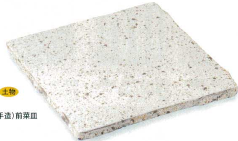
108-4-45B 6,800円 うずら模様四方(手造)前菜皿 18入 20×20×2cm