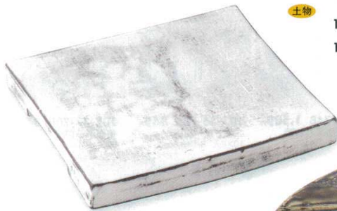
108-9-23B 3,800円 手造り白化粧板目角皿(大) 30入 20.5×17.9×2.5cm