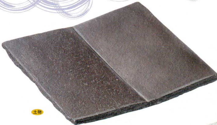
108-3-45B 8,500円 黒陶折り紙形(手造)前菜皿 20入 22.3×21.5×2.5cm

八寸や口変わりに ちょうど絵を描くように盛りたい うつわと語り合いながら 自在の変化を楽しむ これこそ料理人の最上のよろこび