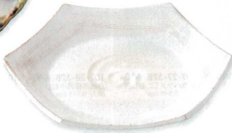
108-6-23B 2,060円 粉引柳目六角皿 50入 20×3.2cm 108-7-23B 2,800円 粉引柳目六角大皿 30入 24×4.8cm