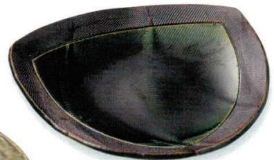
108-11-21B 5,500円 織部中抜き波紋三角皿 40入 22×21×3.5cm