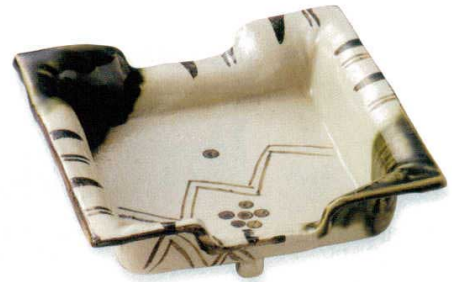
108-2-21B 8,500円 織部四方鉢 40入 19×18.3×6cm