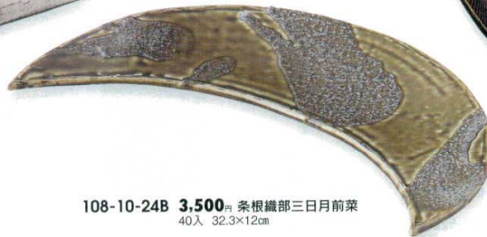
108-10-24B 3,500円 糸根織部三日月前菜 40入 32.3×12cm