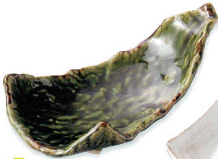
108-5-52B 2,450円 織部変形扇皿 30入 26.5×15×8.3cm