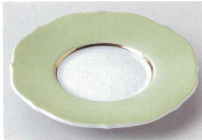
112-3-11B 2,700円 ヒワリム7.0皿 60入 21.5×2.3cm