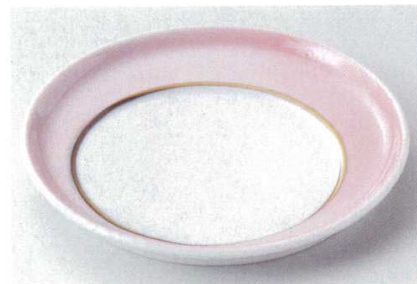
112-7-11B 2,700円 ピンク円合せ皿 60入 18.3×2cm