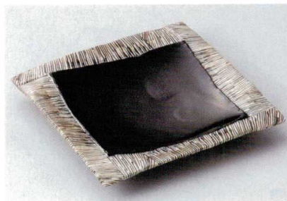
112-14-23B 2,500円 黒織部四辺筋皿 40入 18×2cm