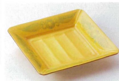
112-13-52B 2,520円 黄南京7.5正角皿(交趾) 30入 16.5×16.5×3cm