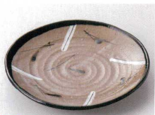
115-19-1B 1,900円 黒織部松葉波型7寸皿 30入 20.7cm