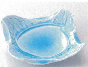
115-18-23B 2,000円 トルコ青砂目四方上り向付 40入 18.5×4.6cm