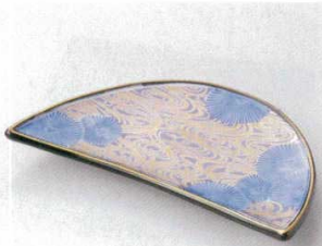
115-5-22B 2,150円 黒釉菊流水平月皿 40入 21.8×11.5×2.5cm