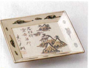
115-17-52B 2,080円 錆山水絵正角皿 60入 16.3×2.5cm