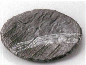
115-13-21B 2,100円 銀河三つ足7.0皿 40入 21×2.5cm