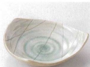
115-11-74B 2,120円 手彫ライン変型鉢 60入 20.1×18.9×5.4cm