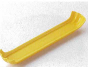
115-14-52B 2,050円 黄釉兩上り尺1前菜皿 60入 32.5×5×4cm