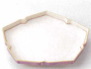
115-1-11B 2,400円 紫吹7.0桔梗皿 40入 21×2.5cm