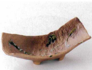
115-10-33B 2,150円 焼アビード口足付前菜皿 40入 24.5×10.5×7.5cm