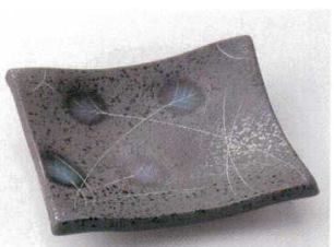
115-20-22B 1,980円 黒吹むさしの手彫皿 30入 18×3.4cm