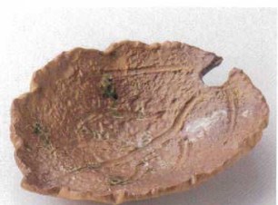
115-16-33B 2,100円 焼アビード口葉形皿小 40入 22×19×4.3cm