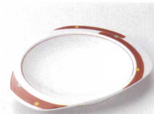
115-4-11B 2,100円 刷毛目水玉前菜皿 60入 22.3×18×2.5cm