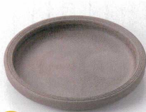
115-2-52B 2,750円 炭化土三ツ足6.3切立丸皿 40入 18.8×3cm