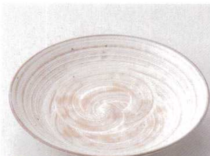
115-7-45B 2,100円 竹目前菜皿 40入 20×3.5cm