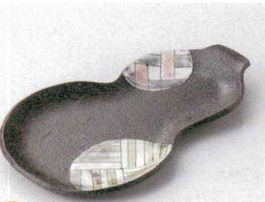
115-9-52B 2,050円 丸紋瓢型付皿 60入 21.7×13.2×2cm