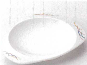
115-3-11B 2,100円 色すずぎ前菜皿 60入 22.3×18×2.5cm