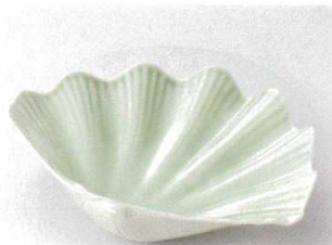
115-12-11B 2,000円 ひわ貝型盛鉢 40入 26.5×20×4.5cm