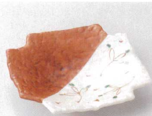
115-6-23B 2,130円 赤半掛四ツ切り皿 60入 18×18×2.9cm