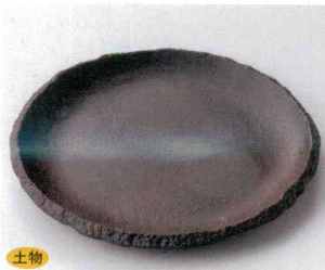
117-7-21B 1,800 円 炭化土丸7.5皿 40入 22.7×2.5cm