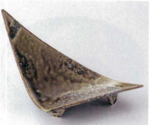
117-13-24B 1,700 円 糸根織部三角小鉢 60入 21×11cm