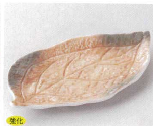
117-4-22B 1,810 円 オレンジ巻グリーン吹木ノ葉皿 40入 23.5×12.5×2.5cm