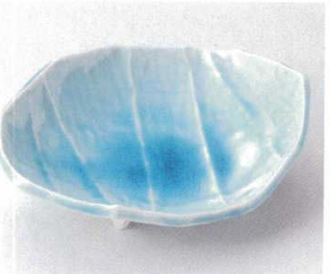
117-17-22B 1,700 円 マリンブルーミツ足前菜皿 23×19.5×5.5cm