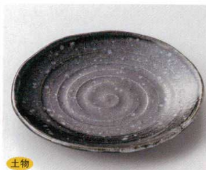
117-8-1B 1,800 円 天目流し波型7.0皿 30入 20.8×2.8cm