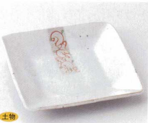
117-14-33B 1,700 円 赤絵唐津四方皿 60入 16.5×16.5cm