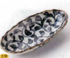
117-19-23B 1,660 円 タコ唐草楕円前菜皿 50入 22.7×10.2×3.7cm