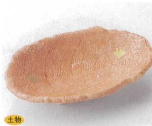
117-3-33B 1,850 円 朱金彩6.5小判皿 80入 19×12.5cm