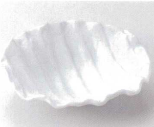
117-6-29B 1,800 円 青白磁甲羅形7.0盛鉢 22×21×5.5cm