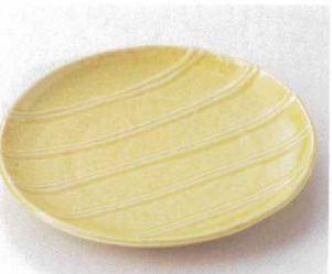
117-18-1B 1,650 円 オレンジ十草7.0皿 40入 22.3×21.3×3cm