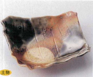
117-9-21B 1,750 円 嵯峨野変形前菜皿 40入 17.5×16×4.5cm