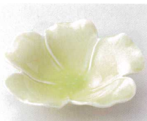
117-16-22B 1,700 円 花型ヒワ釉深皿 30入 23×5.5cm