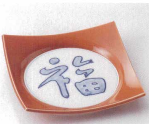
117-15-22B 1,750 円 柿輪福四方皿(大) 40入 17×3cm