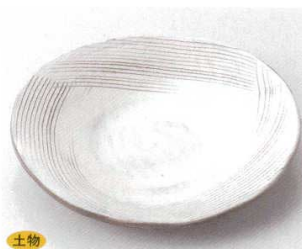
117-12-52B 1,750 円 化粧樽目丸6.5皿 50入 19.5×2.7cm