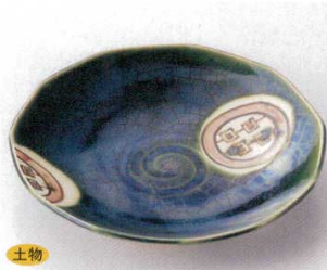
117-2-1B 1,850 円 織部京丸紋八角6.5皿 30入 19.5cm