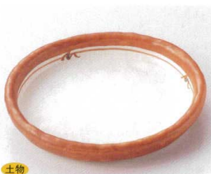
117-20-22B 1,680 円 朱巻切立楕円6.0皿 30入 18.2×15.7×3cm