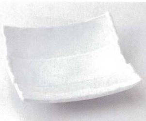
117-10-29B 1,800 円 青白磁三枚重正角皿 19.4×19×4.6cm