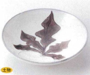
117-1-52B 1,850 円 かぶ絵6.0鉢 50入 18.6×4.7cm