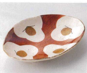
119-7-21B 1,300円 手描橘三つ足楕円皿 40入 21.2×15.5×4cm