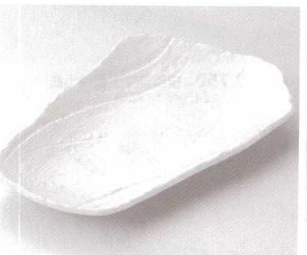
119-17-33B 1,050円 白釉砂目前菜皿 40入 20.5×17cm