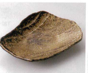
119-18-51B 950円 不動前菜皿 60入 20×17×4cm