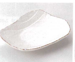
119-19-22B 860円 瀬サビ巻粉引荒瀬前菜皿 50入 21×17×4cm