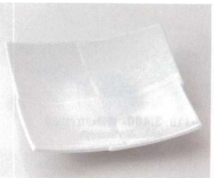
119-13-33B 1,050円 青白磁市松角皿 40入 18.5×18.5cm