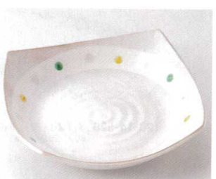
119-16-11B 1,100円 白萩水玉8.0深皿 60入 20.3×5cm