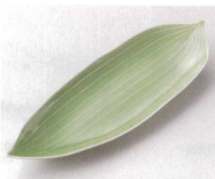
119-3-11B 1,300円 グリーン笹型9.5前菜皿 60入 29.8×10×3cm