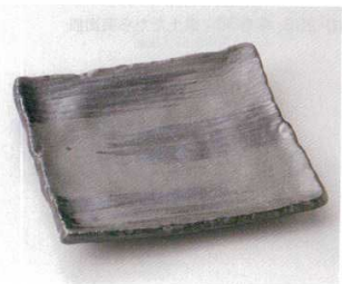
119-9-52B 1,250円 大和瀬正角皿 50入 19.5×19.5×3cm