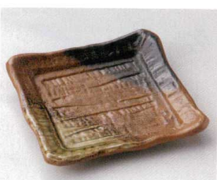
119-8-33B 1,300円 伊賀吹ソギ角皿 30入 18×18cm