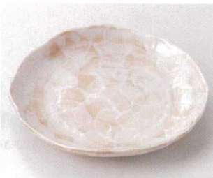
119-2-31B 1,350円 赤志野7.0皿 40入 21.5×21×3.1cm