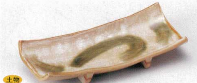
127-14-74B 800円 織部刷毛ゲタ足長皿 40入 22×9.8×4cm