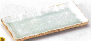
127-10-74B 840円 唐津おふけ付皿 60入 21×10.5×1.8cm