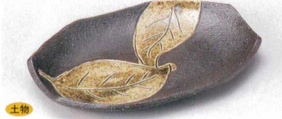
127-8-1B 850円 黒木の葉変形一品皿 40入 21×14cm