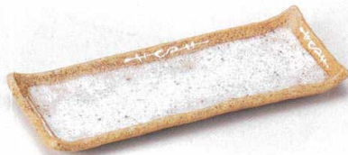
127-13-74B 820円 綿ほうし付皿 60入 24.4×9.5cm