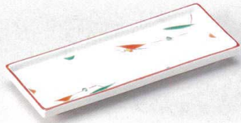
127-1-73B 890円 赤絵つゆ草付皿 60入 21×8×2cm