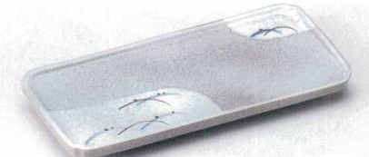
127-20-70B 700円 銀彩つゆ草付皿 60入 21.5×10×2cm