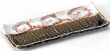
127-4-74B 880円 織部ライン付皿 60入 23.5×9.5×2.2cm