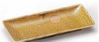
127-18-23B 700円 オリベスキ付皿 60入 23.3×10.4cm