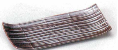
127-21-73B 700円 鉄砂スタレ付皿 80入 20.7×9×2cm