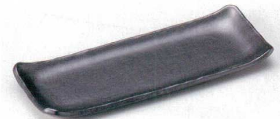
127-11-74B 840円 黒釉付皿 60入 24×9×2.2cm