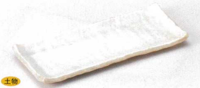
127-3-73B 880円 白雲付皿 60入 24.5×10×2.3cm