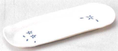
127-6-74B 870円 青い花付皿 60入 21.7×7.5×1.8cm