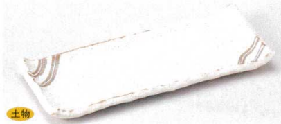
127-2-73B 880円 粉引木目付皿 60入 24.5×10×2.3cm