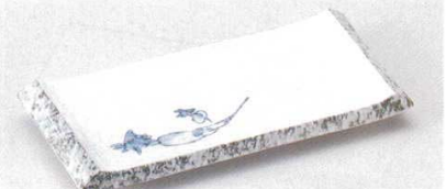
127-15-73B 800円 野菜付皿 50入 22×16×2.8cm