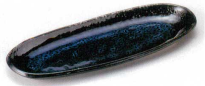
127-9-23B 850円 銀河フェスタ皿(小) 60入 29.1×11.4×4.3cm