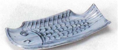
127-12-70B 840円 魚形焼物皿 60入 23×10.5cm