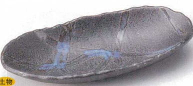
127-19-45B 700円 黒釉 桂川舟形 小鉢 60入 21.8×10.3×3cm