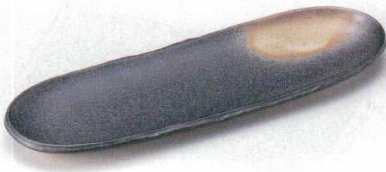
127-7-5B 860円 黒伊賀石目突皿 40入 29.3×9.5×1.5cm