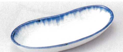
127-17-22B 700円 呉須刷毛空豆型深鉢 50入 22×10×3cm