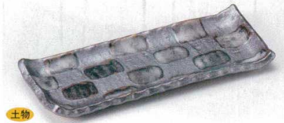
127-5-73B 880円 黒結晶付皿 60入 24.3×9.6×2.3cm