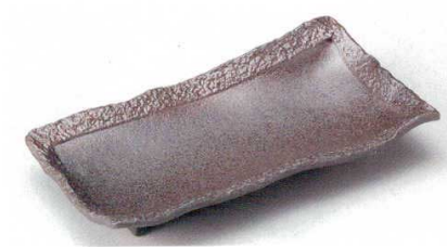
140-4-22B 2,150円 炭化土測砂目備前風焼物皿 40入 23.5×12.3×3.8cm