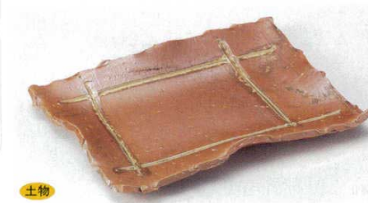
140-16-1B 2,000円 茶イゲタ焼物皿 40入 22×17×2.7cm