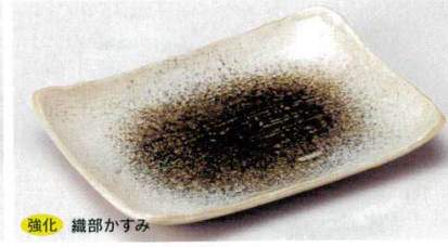
強化 織部かすみ 140-18-73B 1,580円 7.0長角皿 50入 19.5×12.5×2.5cm 140-19-73B 1,800円 8.0長角皿 30入 23×14.3×2.7cm 140-20-73B 2,150円 9.0長角皿 30入 23.5×17×2.7cm