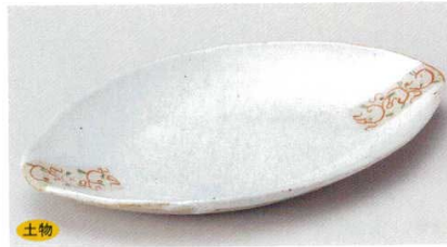
140-7-33B 2,100円 赤絵唐草舟形長皿 30入 23.5×13cm