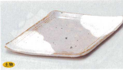
140-14-45B 2,000円 粉引掛菱形前菜皿(手造り) 40入 24.5×15cm