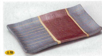
140-13-45B 2,100円 赤古紋焼物皿(手造り) 60入 20×12×2cm