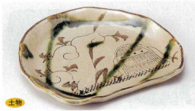
140-17-11B 2,100円 織部流7.0半月皿 40入 21×18×2.5cm