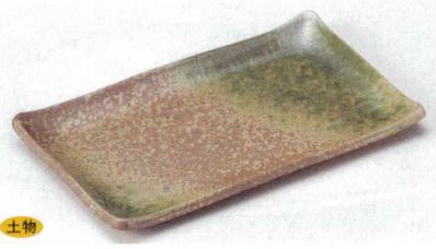
140-2-70B 2,200円 南蛮織部尺長角皿 40入 27×16cm