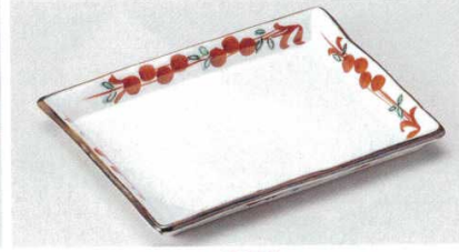
140-15-33B 2,100円 玉花長角皿 40入 19.2×15.3cm