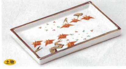
140-9-45B 2,100円 雲錦焼物皿 30入 22.2×13.7×1.5cm