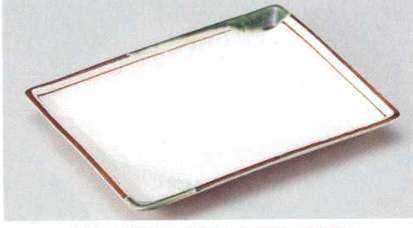
140-6-70B 2,100円 織部掛筋尺長角皿 30入 24.7×18.8cm