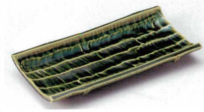
140-12-11B 2,000円 織部竹節焼物皿 40入 25×12.5×3.3cm