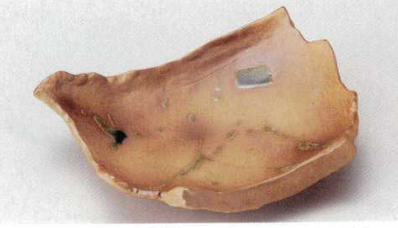
140-5-33B 2,150円 焼アビードロちぎり皿(小) 40入 21×16×6.5cm