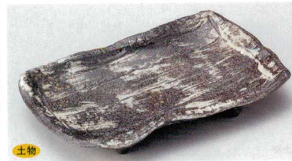
140-10-11B 2,100円 炭化白化粧焼物皿 60入 22.5×14×3.5cm