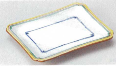
140-11-33B 2,100円 三彩糸巻長角皿 40入 20×15cm