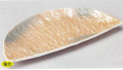
140-8-22B 2,140円 オレンジ巻グリーン吹半月焼物皿 40入 27.2×13×2.2cm