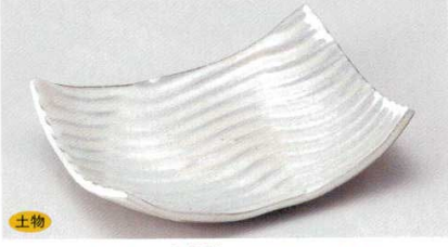
140-3-21B 2,200円 黒土白粉引波長角皿 60入 20×15×5cm