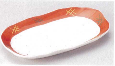
145-13-47B 1,050円 朱帯焼物皿 60入 22.5×12.9×2.6cm