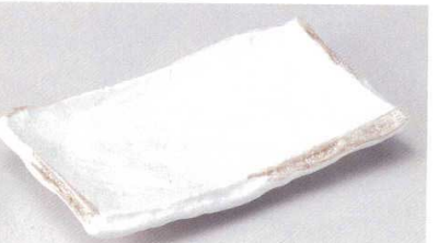
145-19-33B 1,000円 くらま焼物皿 50入 22.5×13.6cm