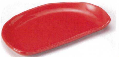
145-14-32B 1,050円 磁器朱塗半月前菜皿 100入 22×12.7×2.4cm