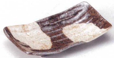
145-3-22B 1,150円 かいらぎ足付向付 40入 21×11.5×4cm