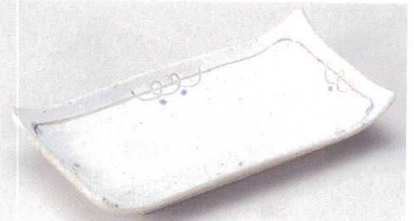
145-11-23B 1,070円 ボルドー焼物皿 60入 21.7×12×3.8cm