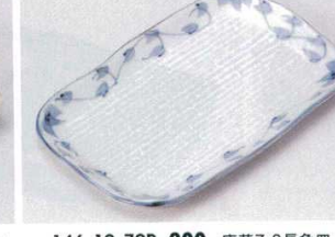
146-19-70B 900円 唐草7.0長角皿 60入 20.3×13×1.5cm