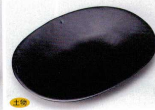
土物 146-10-70B 930円 黒陶小判皿 50入 22.5×16.5cm