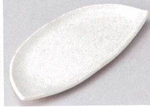
146-4-31B 980円 粉引半月皿 45入 27.7×12.7×3cm