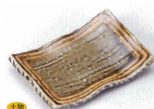
土物 146-5-73B 990円 織部ライン前菜皿 60入 17×12×2.8cm