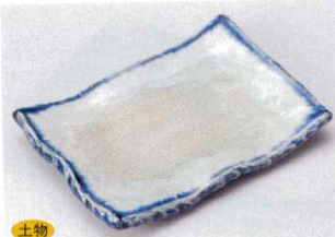
土物 146-1-73B 1,000円 御深井前菜皿 60入 17×12×2.8cm

特選和食器 和食器単品 和食器オープン 特選洋食器 洋食器オープン 洋食器単品 中華器オープン 中華器単品 四口市万古の器 民芸の器 木竹漆器その他