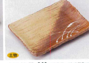
土物 146-16-5B 840円 美濃里一珍干段取皿 80入 16.5×11.8×2cm