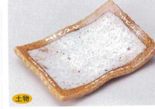
土物 146-17-74B 920円 綿ほうし6.0四ツ足皿 50入 16.5×12×3cm