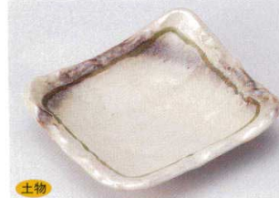
土物 146-9-33B 970円 天竜流四ツ足角皿 60入 17×14.7cm