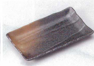
146-6-32B 960円 古代釉れいめいソギ焼物皿 60入 24.5×14.5×2.5cm