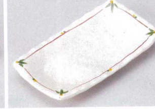
146-14-21B 920円 いこみ笹紋長角皿 80入 21.5×11.8×3cm