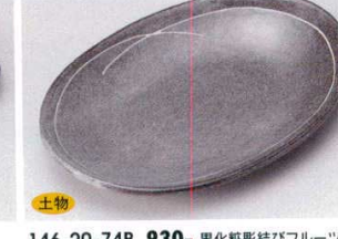
土物 146-20-74B 930円 黒化紙影結びフルーツ皿 60入 20.7×14.2×2.7cm