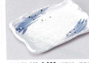
146-21-33B 1,000円 涼風2.2cm焼物皿 40入 22×15×2cm