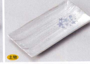
土物 146-15-45B 900円 紫桜合せ長角皿 50入 25×12×2cm