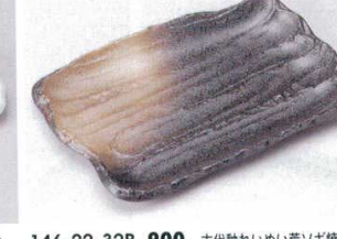
146-22-32B 900円 古代釉れいめい荒ソギ焼物皿 60入 22×15×1.7cm