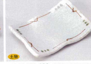
土物 146-18-74B 900円 織部結び6.0四ツ足皿 60入 16.5×12×3cm