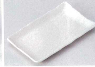
146-11-5B 920円 粉引ソギ焼物皿 40入 24×14×2cm