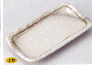
土物 146-8-33B 970円 天竜流四ツ足長角皿 60入 21.2×11.5cm