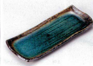
146-7-32B 750円 黒櫻干段トルコブルー突出皿 60入 26.5×10.7×2.3cm