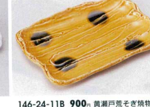
146-24-11B 900円 黄瀬戸荒そぎ焼物皿 80入 22×15×2cm