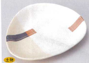
土物 146-2-33B 1,000円 セピアライン三角中皿 80入 19×15.5cm