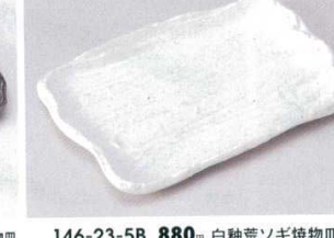
146-23-5B 880円 白釉荒ソギ焼物皿 40入 22×15×2.2cm