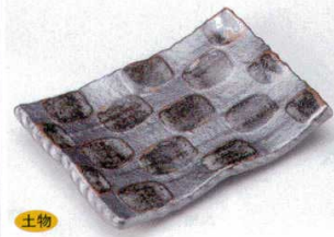
土物 146-3-73B 1,000円 黒結晶前菜皿 60入 17×12×2.8cm