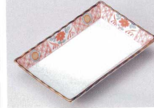
146-13-51B 920円 七宝菊焼物皿 60入 20×12.8×3.5cm