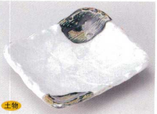
147-13-23B 860円 白志野角皿 50入 17×14.5×4.2cm