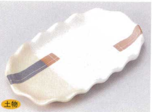
147-10-33B 760円 セピアライン波型焼物皿 40入 21.5×12.3×2.3cm