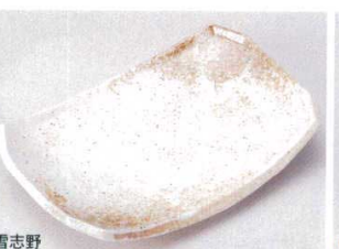
147-23-52B 500円 長角6.0皿 60入 18.7×12.7cm 147-24-52B 780円 長角8.0皿 40入 22×14.7cm