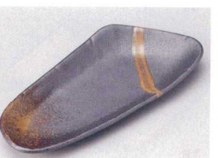
147-16-43B 850円 吹き流し三角長皿 60入 27×12.5×2.5cm