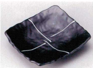
147-2-33B 840円 黒白一珍角皿 50入 17×15.2cm