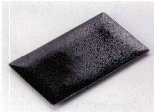
147-1-5B 860円 黒水晶薄口7.0長角皿 60入 22.8×13.2×1.3cm