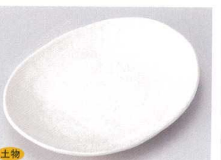
147-20-74B 800円 粉引T楕円皿(中) 60入 22×17×3.3cm