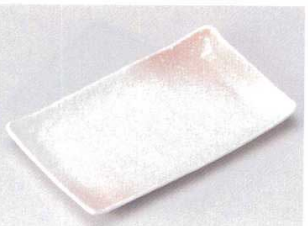
147-11-43B 880円 弥生木肌焼物皿 60入 23.8×14.2×2cm