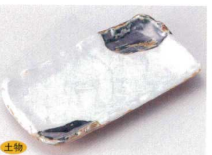
147-12-23B 860円 白志野長角皿 60入 21.5×11.5×3cm