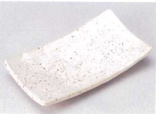
147-6-13B 860円 白うの心焼物皿 40入 22×12.2cm