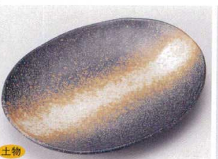
147-19-74B 800円 黒備前T楕円皿(中) 60入 22×17×3.3cm