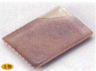
147-7-70B 860円 灰釉掛線紋焼物皿 60入 18.5×12.5cm