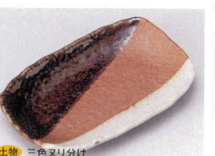
147-25-76B 590円 7.0長角皿 60入 20×13.2×3cm 147-26-76B 850円 8.0長角皿 40入 22.8×14.5×2.5cm