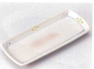
147-8-74B 860円 萩風早春付出皿 60入 25×10.7×2.5cm