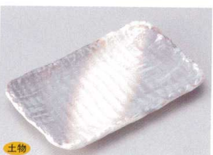
147-4-84B 1,000円 かすみ志野9号長角皿 30入 27×16.7×3.5cm