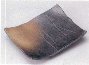
147-5-32B 880円 古代釉れいめい四ツ足焼物皿 50入 22×16.5×4cm