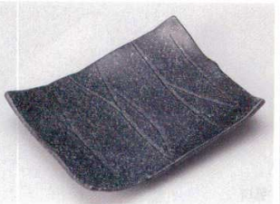
147-17-32B 880円 黒銀彩四ツ足焼物皿 40入 22×16.5×4cm