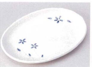
147-15-74B 880円 青い花6.0小判皿 60入 18.7×13.3×1.7cm