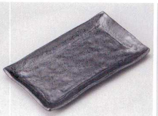
147-21-43B 800円 黒結晶新焼物皿 50入 22.1×12.2×2.3cm