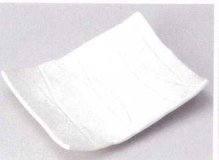
147-18-33B 840円 アイボリー7.0焼物皿 40入 21×6.3cm