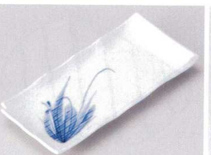
147-22-70B 760円 浮草中鮎皿 60入 22.5×10.5cm