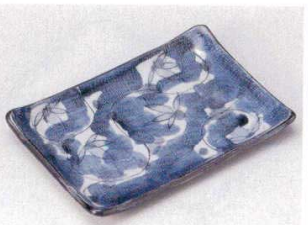
147-14-70B 820円 古染唐草7.0長角皿 60入 19×12.7cm