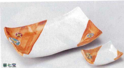
華七宝 152-1-20B 4,300円 焼物皿 50入 23.4×14×4cm 152-2-20B 1,580円 角千代口 200入 9.8×7.3×2.5cm

特選和食器 和食器単品 和食器オープン 特選洋食器 洋食器オープン 洋食器単品 中華オープン 中華食器単品 四角市万古の器 民芸の器 木竹器等の他