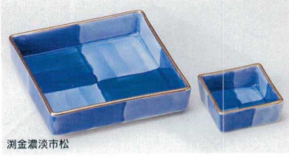
測金濃淡市松 152-18-52B 2,400円 正角6.5鉢 40入 14.5×3.5cm 152-19-52B 980円 正角千代口 100入 7×2.8cm