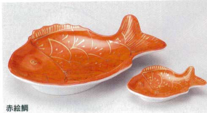
赤絵鯛 152-7-74B 2,700円 8.0焼物皿 40入 23.5×16×4cm 152-8-74B 1,060円 小皿 120入 11.7×7.6×2.2cm