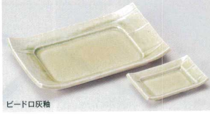
ビードロ灰釉 152-24-76B 1,050円 5.5長角四方皿 80入 16.5×10×2.2cm 152-25-76B 1,900円 7.5長角四方皿 40入 22.5×13.5×2.7cm 152-26-76B 580円 長角四方小皿 150入 10.7×6.8×2cm