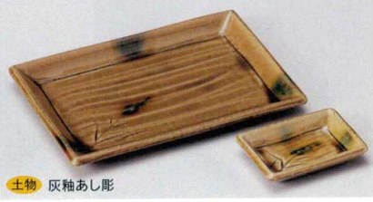
土物 灰釉あし彫 152-11-52B 2,600円 焼物皿 40入 21.7×14.5cm 152-12-52B 900円 長角千代口 120入 9.5×6.5cm