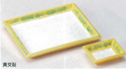
黄文趾 152-9-33B 2,550円 焼物皿 40入 20×16cm 152-10-33B 1,280円 長千代口 120入 8.5×7×2.5cm