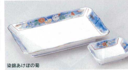
染錦あけぼの菊 152-34-22B 1,750円 焼物皿 40入 22.6×13×3.5cm 152-35-22B 800円 角千代口 200入 9.8×7.1×2.9cm