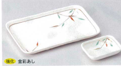
強化 金彩あし 152-22-74B 2,000円 8.0焼物皿 40入 20.5×13.5cm 152-23-74B 850円 小皿 200入 8.6×6.5cm