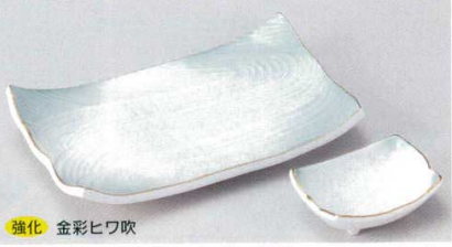
強化 金彩ヒワ吹 152-5-74B 3,100円 8.0長角皿 40入 21×12.5×3.8cm 152-6-74B 1,060円 長角小皿 150入 9×6.7×3cm