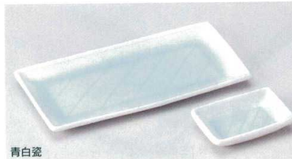
青白瓷 152-13-1B 2,500円 長角8.0皿 40入 21.8×10.8cm 152-14-1B 1,300円 長角千代口 160入 9×6.5×2cm