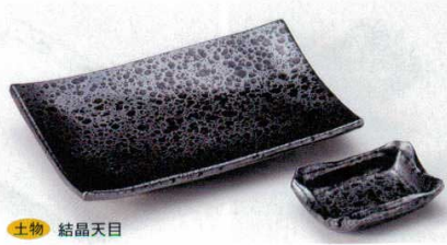
土物 結晶天目 152-3-45B 3,800円 足付焼物皿(手造り) 30入 21×13.5×4cm 152-4-45B 820円 角千代口(手造り) 200入 9.2×6.5×2.5cm