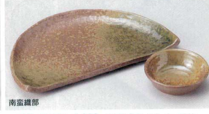
南蛮織部 152-38-70B 1,200円 半月7.0皿 40入 21×12.5cm 152-39-70B 1,650円 半月8.0皿 40入 24.3×14.5cm 152-40-70B 500円 千代口 200入 8.8×3cm