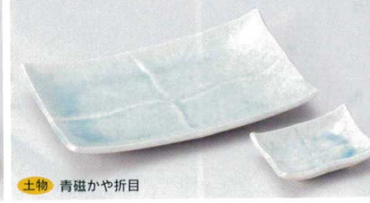
土物 青磁かや折目 152-36-21B 1,800円 足付長角鉢 30入 22×13.5×3.5cm 152-37-21B 460円 足付千代口 200入 9×6.5×2.5cm