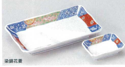
染錦花菱 152-32-52B 1,750円 波形焼物皿 40入 22.8×13×3.5cm 152-33-52B 800円 波形長角千代口 120入 9.7×7×3cm