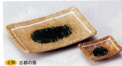
土物 古都の香 152-20-73B 2,200円 8.0焼物皿 40入 22.3×15.2×4cm 152-21-73B 510円 小皿 150入 10.5×8×3cm