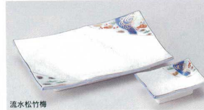
流水松竹梅 152-27-33B 1,920円 焼物皿 40入 22.5×14cm 152-28-33B 890円 長千代口 200入 9.2×6.7cm