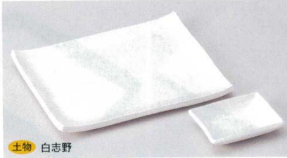
土物 白志野 152-15-73B 2,260円 7.0長角皿 50入 20×15.5×2cm 152-16-73B 2,460円 9.0長角皿 30入 23×16×2.2cm 152-17-73B 500円 長角小皿 200入 8.7×6.6×2.2cm