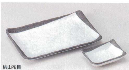
桃山布目 155-9-76B 800円 7.0長角皿 60入 20.5×13cm 155-10-76B 320円 長角小皿 200入 9×6.5cm