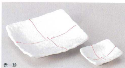
赤一珍 155-3-33B 840円 角皿 50入 17×15.2cm 155-4-33B 460円 角小付 200入 9×7.5cm