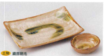
土物 織部刷毛 155-20-74B 770円 7.0焼物皿 40入 20.5×14.2×2.8cm 155-21-74B 270円 楕円千代口 150入 8.8×7.5×3cm