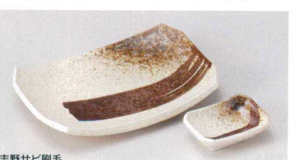
志野サビ刷毛 155-36-25B 730円 長角8.0皿 40入 21.9×14.8×3.7cm 155-37-25B 270円 角千代久 200入 8.7×6.4×2.7cm