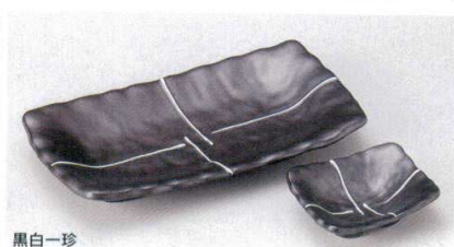
黒白一珍 155-5-33B 840円 焼物皿 60入 21.5×11.5cm 155-6-33B 460円 角小付 200入 9×7.5cm