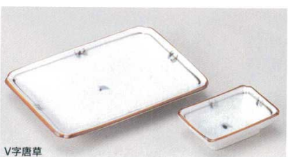
V字唐草 155-15-70B 600円 7.0長角皿 60入 18.5×13cm 155-16-70B 780円 8.0皿 60入 21.2×14.3cm 155-17-70B 250円 長角小皿 200入 9×6.3cm