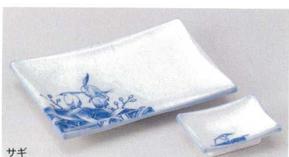
サギ 155-11-73B 800円 長角皿 40入 20.5×14×3.2cm 155-12-73B 300円 小皿 200入 9.2×6.5×2.8cm