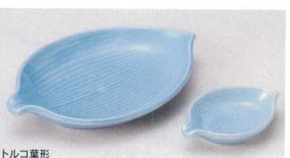
トルコ葉形 155-28-74B 760円 焼物皿 50入 20.5×13.5cm 155-29-74B 320円 小皿 200入 10.7×7.5cm