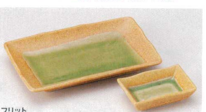
フリット 155-30-21B 760円 7.0焼物皿 40入 21×13cm 155-31-21B 400円 千代口 180入 9.7×6.5cm