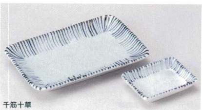
千筋十草 155-13-76B 800円 7.0長角皿 60入 19.5×12.5×2.7cm 155-14-76B 320円 長角千代口 150入 9.5×7.3×3cm