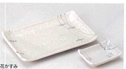
花かすみ 155-26-70B 760円 7.0皿 60入 20.2×12.6cm 155-27-70B 280円 長角小皿 240入 9×6.3cm