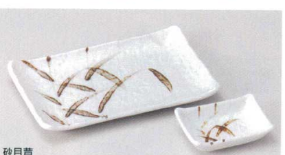
砂目芦 155-24-70B 760円 7.0長角皿 60入 20×12.6cm 155-25-70B 280円 長角小皿 200入 9×6.2cm