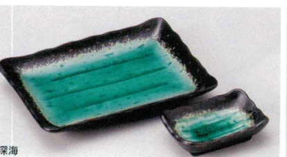
深海 155-32-31B 750円 焼物皿 40入 21×15×3.5cm 155-33-31B 390円 角千代口 100入 13.8×8×2.4cm