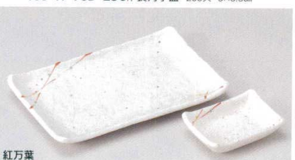
紅万葉 155-22-70B 760円 7.0長角皿 60入 20.3×13×2cm 155-23-70B 280円 長角小皿 180入 9×6.5×2cm