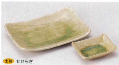
土物 せせらぎ 155-1-70B 850円 7.0皿 60入 19.6×12.8cm 155-2-70B 490円 長角小皿 180入 9.5×7cm

特選和食器 和食器単品 和食器オープン 特選洋食器 洋食器オープン 洋食器単品 中華オープン 中華食器単品 四日市万古の器 民芸の器 木竹製皿その他