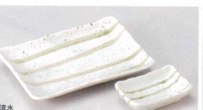
流水 155-34-33B 730円 焼物皿 40入 21×14cm 155-35-33B 360円 長千代口 200入 11×7cm