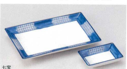
七宝 155-18-74B 780円 7.0皿 60入 20×13cm 155-19-74B 330円 小皿 200入 9.2×6.2cm