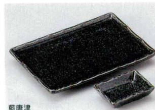
藍唐津 156-28-21B 500円 6.0焼物皿 80入 16.8×11.4×2.5cm 156-29-21B 670円 8.0焼物皿 50入 20.7×14.1×2.5cm 156-30-21B 310円 千代口 180入 8.3×6.1×2.3cm