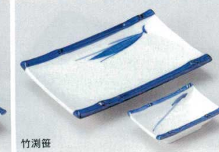
竹測笹 156-52-74B 370円 6.0皿 60入 17×11.3cm 156-53-74B 160円 小皿 300入 8.5×5.5cm