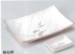
粉引芦 156-3-70B 720円 8.0長角皿 50入 21×14.2cm 156-4-70B 190円 長角小皿 240入 8.6×5.9cm