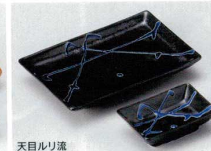
天目ルリ流し 156-48-74B 460円 6.0焼物皿 60入 16.8×11×2.8cm 156-49-74B 260円 小皿 200入 9.3×6×2.8cm