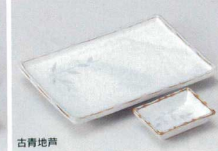
古青地芦 156-35-21B 660円 8.0焼物皿 40入 20.5×14×2.2cm 156-36-21B 320円 長角千代口 200入 8.2×6×2.5cm