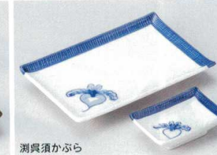
測興須かぶら 156-50-70B 400円 6.0皿 80入 16.6×11.2cm 156-51-70B 150円 千代口 200入 8.4×5.8cm