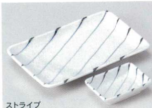
ストライプ 156-9-74B 700円 7.0皿 60入 20×13cm 156-10-74B 280円 小皿 200入 9×6.2cm