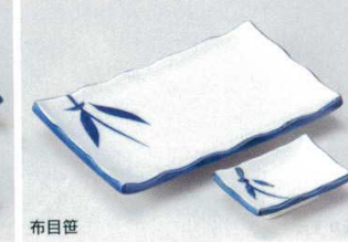
布目笹 156-43-74B 420円 6.0皿 60入 17×11.5cm 156-44-74B 600円 7.0焼物皿 60入 19.7×12.5cm 156-45-74B 170円 小皿 300入 8.5×6cm