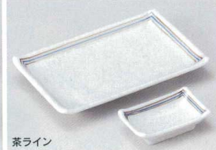
茶ライン 156-7-74B 710円 7.0焼物皿 60入 20.5×13×3cm 156-8-74B 250円 小皿 200入 9.5×5.8×2.8cm