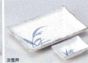
淡雪芦 156-33-70B 660円 7.0長角皿 60入 20×13.4cm 156-34-70B 220円 長角小皿 200入 9.5×6.2cm