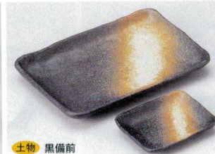
土物 黒備前 156-20-70B 680円 7.0長角皿 50入 20.5×13.5×2.5cm 156-21-70B 220円 長角小皿 200入 10.5×8×1.8cm