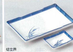
切立芦 156-41-70B 600円 7.0長角皿 60入 19×12cm 156-42-70B 190円 小皿 200入 8.2×6cm