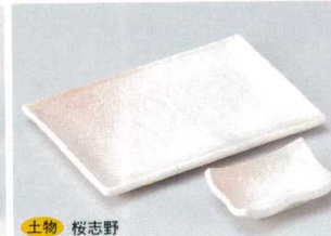
土物 桜志野 156-31-74B 670円 7.0焼物皿 60入 20×13.7cm 156-32-74B 320円 千代口 200入 9×6.2cm