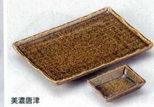
美濃唐津 156-25-21B 500円 6.0焼物皿 80入 16.8×11.4×2.5cm 156-26-21B 670円 8.0焼物皿 50入 20.7×14.1×2.5cm 156-27-21B 310円 千代口 200入 8.2×6×2.3cm