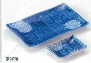
京祥瑞 156-16-70B 680円 8.0長角皿 50入 22.5×14cm 156-17-70B 320円 長角小皿 200入 10.3×7.3cm