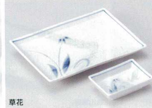
草花 156-14-74B 700円 7.0皿 60入 19.5×14cm 156-15-74B 250円 小皿 200入 9×6.2cm