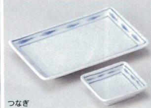
つなぎ 156-5-70B 720円 7.0長角皿 60入 20×12.5cm 156-6-70B 280円 小皿 200入 8.5×7.7cm