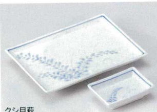
クシ目萩 156-1-70B 720円 7.0皿 60入 19.5×13.7cm 156-2-70B 280円 長角小皿 200入 9×6.2cm

特選和食器 和食器単品 和食器オープン 特選洋食器 洋食器オープン 洋食器単品 中華オープン 中華食器単品 四目巾乃古の器 民芸の器 木竹装飾その他