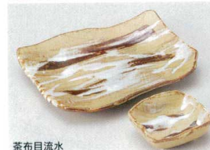
茶布目流水 156-37-45B 640円 角焼物皿 80入 18.5×14.3×3cm 156-38-45B 290円 角千代口 200入 8.5×7.5×3.5cm