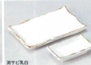
測サビ乳白 156-39-73B 620円 6.0長角皿 80入 18×11.3×2cm 156-40-73B 460円 千代口 200入 10.8×6.5×2.5cm