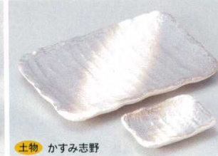
土物 かすみ志野 156-22-84B 430円 5号長角皿 80入 16.5×13×2.2cm 156-23-84B 680円 7号長角皿 60入 21.2×14.3×2.5cm 156-24-84B 230円 角千代口 200入 9.7×6.8×2cm