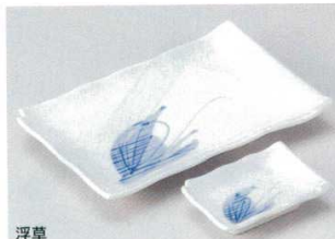
浮草 156-18-70B 680円 7.0長角皿 60入 20×13cm 156-19-70B 270円 千代口 200入 9×6.5cm