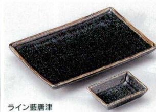
ライン藍唐津 156-11-52B 550円 長角6.0皿 60入 17×11.5×2.5cm 156-12-52B 700円 焼物皿 40入 21×14.5×2.5cm 156-13-52B 320円 長角千代口 120入 8.6×6×2.5cm