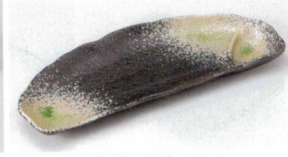
158-11-21B 1,250 円 磯辺寿司皿 30入 30.8×12×3cm