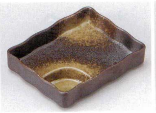
158-22-32B 620 円 黒伊賀吹仕切皿 60入 14.5×11.5cm