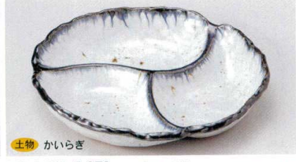
158-2-23B 1,880 円 三ツ仕切皿(小) 40入 20.5×20×3.5cm 158-3-23B 3,320 円 三ツ仕切皿(大) 30入 27×25×4.8cm