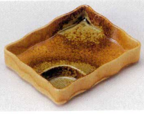
158-23-32B 620 円 伊賀織部仕切皿 60入 14.5×11.5cm