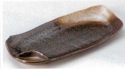
158-7-31B 1,100 円 黒水晶仕切トレー 20入 33.7×15×4.3cm