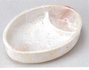
158-15-21B 1,100 円 桜志野チヨク付小判皿 40入 18.8×14×3.8cm