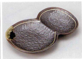
158-21-70B 430 円 鉄軸ライン得々取皿 100入 18×11.7×2cm