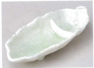
158-17-33B 1,260 円 もえぎハーモニー鉢 60入 22×10cm