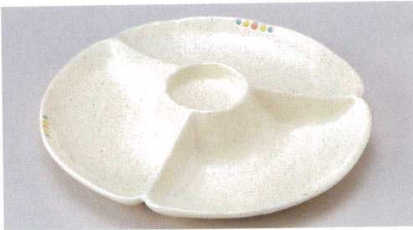
158-1-73B 4,000 円 点あそび富士型仕切皿 20入 25.5×4.7cm