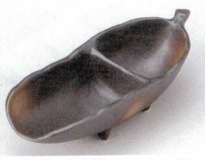
158-19-52B 1,350 円 備前風スティックトレー 60入 21×7.8×5.2cm