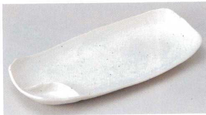
158-6-31B 1,100 円 白粉引仕切トレー 20入 33.7×15×4.3cm