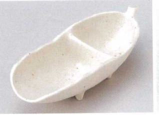
158-18-52B 1,350 円 粉引スティックトレー 60入 21×7.8×5.2cm