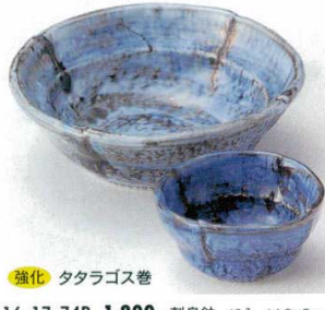
強化 タタラゴス巻

16-15-74B 1,300円 刺身鉢 40入 15×4cm 16-16-74B 420円 千代口 200入 8.5×2cm