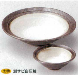
土物 潤サビ白灰釉

16-9-52B 1,780円 花型刺身鉢 60入 16×5.3cm 16-10-52B 950円 花型千代口 120入 9.4×3.1cm