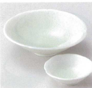
16-27-32B 930円 若草輪花4.5鉢 60入 15×4.4cm 16-28-32B 320円 うくいず色輪花千代口 160入 8.5×3cm

16-25-33B 2,500円 刺身 60入 14.3×4.8cm 16-26-33B 900円 千代口 200入 7.9×2.7cm