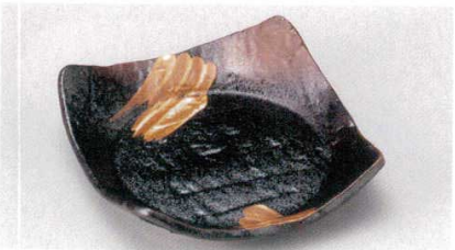
163-7-22B 950円 白刷毛唐津四方皿(中) 60入 15.6×15.3×4cm