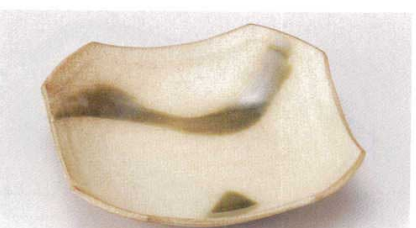
163-17-21B 500円 織部京四方6.5皿 60入 21.5×18.5×4.4cm