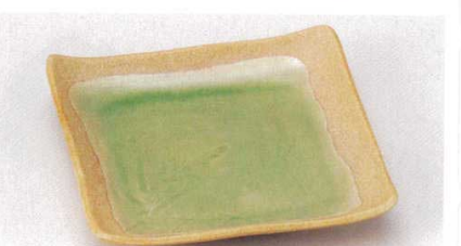
163-15-21B 850円 フリットステーキ皿 40入 18×18×3.5cm