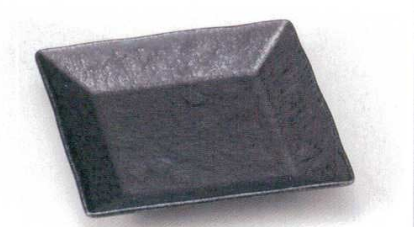
163-13-25B 800円 黒水晶しおり角皿 60入 16.2×16.2×2.3cm