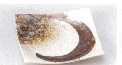
163-18-25B 600円 志野サビ刷毛正角5.5皿 50入 17.3×17.3cm