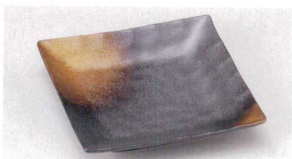
163-11-31B 880円 備前風金茶吹正角皿(大) 40入 18.4×18.4×2.7cm