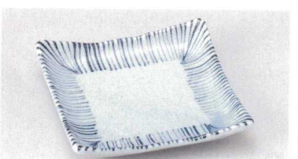
163-12-76B 880円 千筋十草正角皿 40入 16.7×16.7×3.5cm