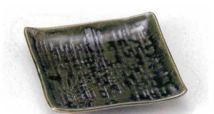
163-9-21B 960円 織部かすりステーキ皿 40入 17.9×17.9×3.5cm