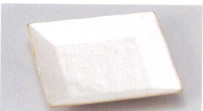
163-14-25B 800円 粉引しおり角皿 60入 16.2×16.2×2.3cm