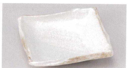
163-6-33B 1,000円 くらま6.0湖紋皿 40入 18.5×18.5cm