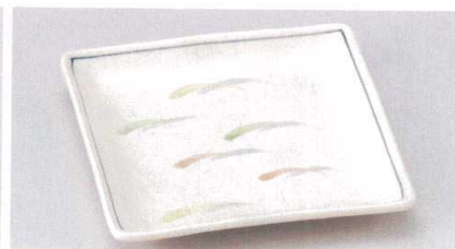
163-5-74B 970円 武蔵野6.0正角皿 60入 17.5×17.5cm