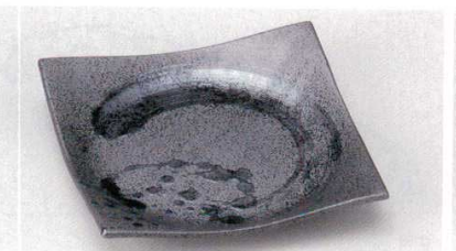
163-16-43B 630円 黒軸手引正角5.5皿 60入 17.3×3cm