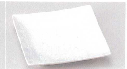
163-10-31B 880円 淡雪正角天皿 30入 18.4×18.4×2.7cm