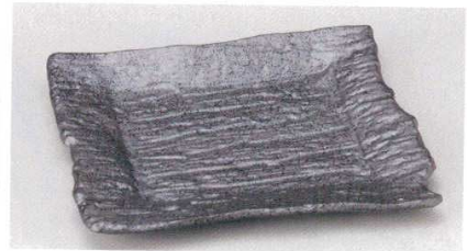
163-3-13B 1,050円 黒結晶ちぎり皿 40入 20×17×2cm