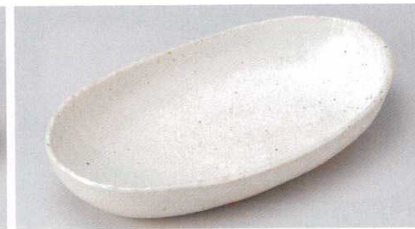
166-23-32B 2,470 円 白釉小判オードブル大皿 10入 31.5×18×5.3cm