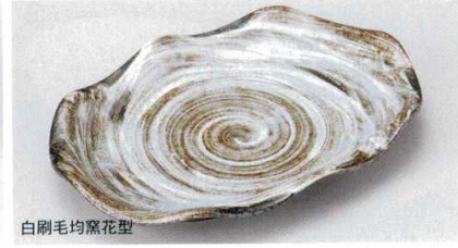
166-11-70B 1,150 円 小判プラター(中) 60入 18.5×13.5cm 166-12-70B 2,000 円 小判プラター(大) 50入 28×18cm