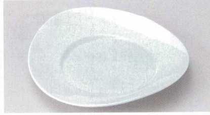
166-7-45B 2,150 円 青白磁両上がり8.0皿 30入 23.8×23×4.7cm