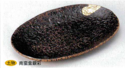
166-9-76B 800 円 6.0楕円皿 100入 17.8×13.5×2.3cm 166-10-76B 2,100 円 9.0楕円皿 30入 27×20×2.5cm