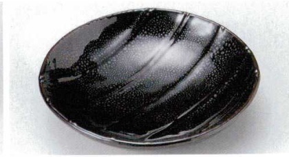
166-18-1B 1,780 円 油天目十草6.0浅鉢 50入 18.3×17.8×4.3cm