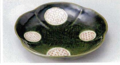
166-8-29B 2,070 円 織部祥瑞梅型大皿 30入 23.5×4cm