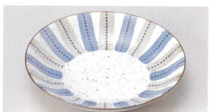
171-9-52B 680 円 マット十草6.5皿 60入 20×3.8cm