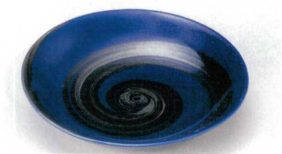
171-10-25B 700 円 銀彩ブルー丸6.0皿 80入 20.2cm