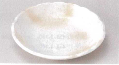
171-14-24B 400 円 弥生型あかね7.0深皿 60入 22.3×4cm