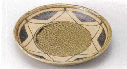
171-1-52B 1,320 円 三角織部玉洲6.5皿 60入 20.2×3.2cm

特選和食器 和食器単品 和食器オープン 特選洋食器 洋食器オープン 洋食器単品 中華オープン 中華食器単品 四日市万古の器 民芸の器 木竹製器その他