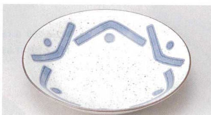
171-8-52B 680 円 マットバstral6.5皿 60入 20×3.8cm