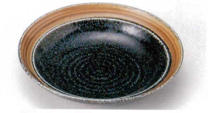
171-13-52B 400 円 ライン藍唐津丸6.5深皿 60入 19.8×4cm