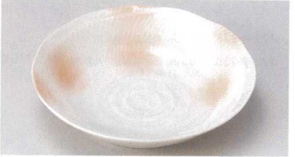
171-15-33B 380 円 トチリ贈7.0深皿 50入 22×4.8cm