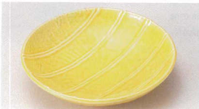
171-4-1B 1,300 円 オレンジ十草6.0浅鉢 50入 18.3×17.8×4.3cm