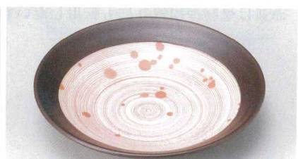
171-6-25B 950 円 紅染6.0皿 60入 20×4cm