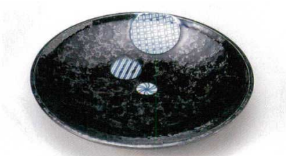
171-11-25B 530 円 丸小紋丸6.0皿 60入 19.3×2.8cm