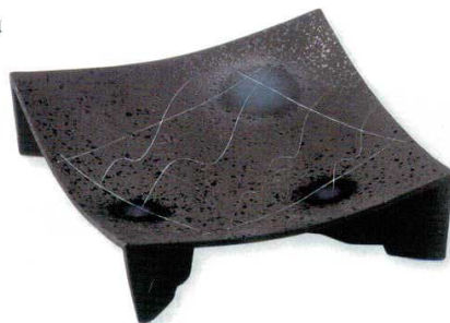
18-6-22B 2,700円 黒マット線彫正角皿(大) 30入 19.5×6cm