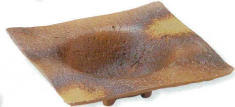
18-7-24B 2,300円 美濃備前六寸角くほみ鉢 40入 19×4.8cm