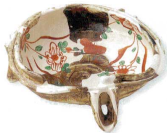
18-9-23B 5,500円 白流赤絵万歴三ツ足鉢 30入 19.7×18.8×7cm