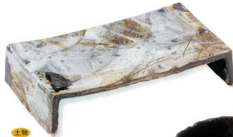
18-1-43B 7,800円 水墨彩ブリッジプレート 10入 23×13.5×5.5cm