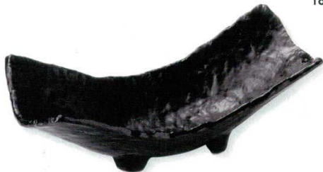
18-8-22B 2,000円 黒釉 両上り向付 21×14×9cm