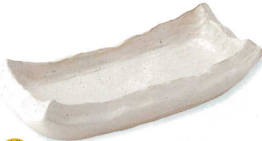
18-11-24B 4,000円 サビ白空洞うつわ(大) 30入 19.5×14.5×5cm