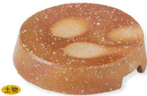
18-5-45B 4,200円 伊賀 焼締台形向付 手造 40入 14.5×3.5cm