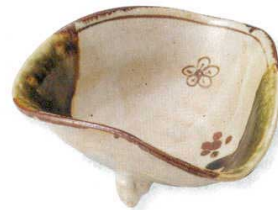
18-3-11B 4,200円 織部鉄仙三ツ足向付 30入 16×16×6cm