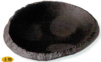
18-2-21B 1,400円 炭化土丸向付 50入 19.4×18×4.5cm