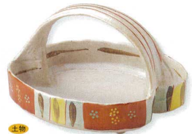
18-10-22B 4,500円 赤絵小紋変形手付鉢 20入 20.5×16×12.8cm