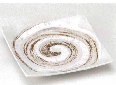
181-8-43B 4,250円 鳴門手引正角9.0皿 15入 28×28×4cm