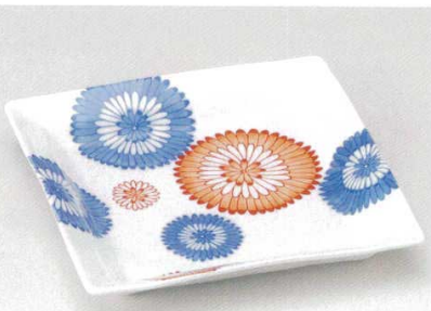
181-5-29B 4,300円 小粋角大皿 16入 27.8×27.8×4cm