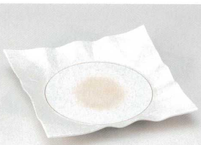
181-6-32B 4,300円 一珍ラスター折紙浅口 12入 27.5×27.5×4cm