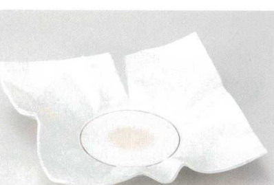
181-12-32B 4,300円 一珍ラスター折紙深口 12入 26.5×26.5×5.5cm