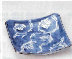
古染唐草 184-11-70B 1,550 円 7.0四方皿 30入 17.5角×4.2cm 184-12-70B 3,000 円 尺四方皿 20入 24角×4.5cm