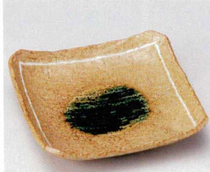
土物 184-3-73B 4,500 円 古都の香8.0盛皿 40入 23.5×23.5×5cm