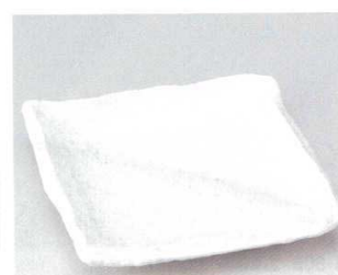
184-19-23B 2,350 円 さざ波白正角大皿 20入 23×23×4cm