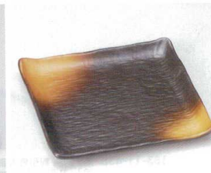
184-22-45B 2,200 円 黒備前吹正角皿 20入 23.5×23.5×2.8cm