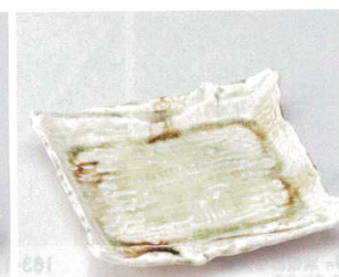
強化 184-20-11B 2,300 円 灰釉ビード口正角皿 22×21×4.2×2.300cm