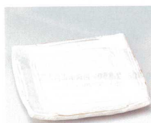
土物 184-15-61B 2,600 円 粉引白雲正角盛皿 20入 24×24×3cm