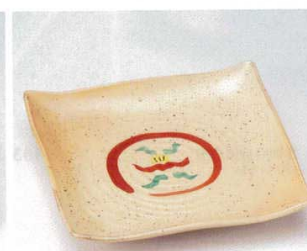
184-16-21B 2,000 円 紅花紋正角皿 30入 22.2×4cm