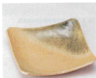
土物 184-9-74B 3,300 円 若草10.0正角大皿 20入 23.5×4.5cm