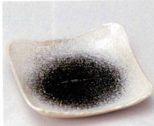
強化 184-2-73B 4,500 円 織部かすみ正角10.0皿 20入 23×22.5×4.5cm