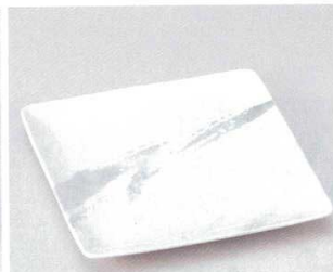
土物 184-6-25B 3,350 円 薄墨雲8.0正角皿 40入 24.7×24.7cm