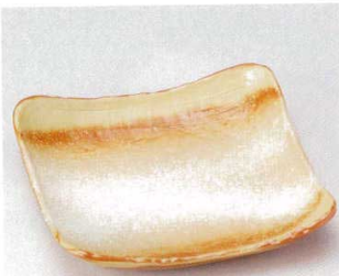
強化 184-1-73B 4,500 円 春結晶正角10.0皿 30入 23×23×4.5cm

特選和食器 和食器単品 和食器オープン 特選洋食器 洋食器オープン 洋食器単品 中華オープン 中華食器単品 西日本万古の器 尾釜の器 本竹製器その他