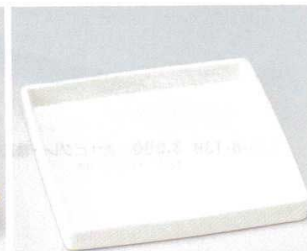
184-18-32B 2,480 円 アイボリー切立四方皿 8入 24×24×2.5cm