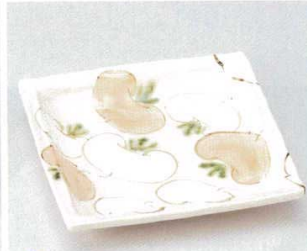
土物 184-8-33B 3,250 円 手描紅かぶら7.0盛皿 20入 21.9×1.9cm