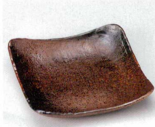
土物 184-4-76B 3,700 円 南蛮織部正角大皿 15入 23×23×5cm