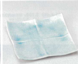
土物 青磁 184-13-21B 690 円 かや折目四方上り(小) 100入 13×2.5cm 184-14-21B 2,950 円 ふわり皿特大 40入 23×4.7cm