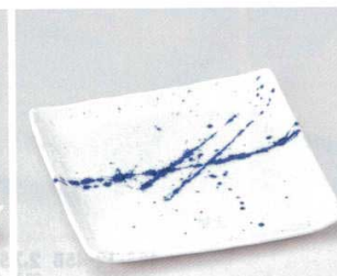
184-21-45B 2,200 円 呉須吹掛梅目正角皿八寸角 20入 23.5×23.5×2.8cm