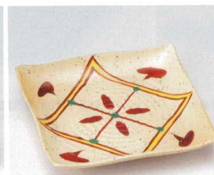
184-17-21B 2,500 円 紅菱紋正角皿 30入 22.2×4cm