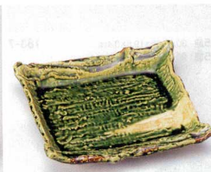
強化 土物 184-10-33B 2,600 円 織部四方皿 30入 21.5cm